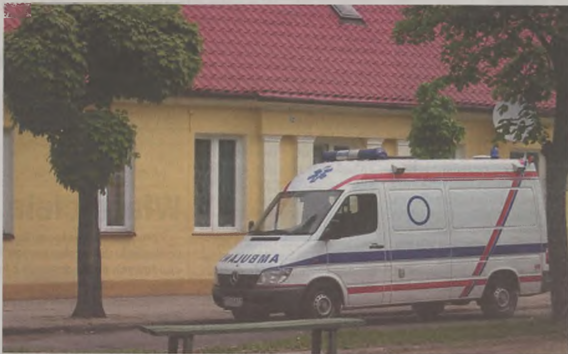
Karetka na ulicę Kaliską dotarł zbyt późno. Staruszka nie udało się uratować.

Kiedy 73-letni mieszkaniec ulicy Kaliskiej zasłabł, sąsiedzi wezwali pogotowie i czekali. Twierdzą, że blisko pół godziny. W tym czasie staruszek umierał na ich oczach. W końcu przyjechała karetka, ale bez tak bardzo potrzebnego lekarza.