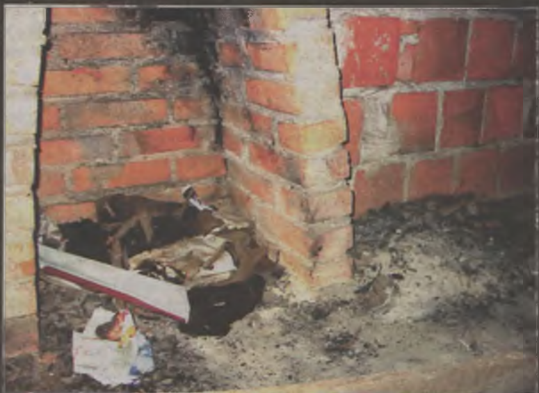
Po tragicznym wydarzeniu w nowo budowanym domu pozostały tylko nadpalone szmaty.

Z wyjaśnień wynika, że zanim doszło do podpalenia, obaj chłopcy w nowo budowanym budynku odurzali się rozpuszczalnikiem. Między nimi wywiązała się sprzeczka. Czterastoletek uderzył swojego kolegę deską. Kiedy ten upadł, zabrał mu portfel. W środku były tylko dokumenty. To nie spodobało się czterastoletkowi, który znów zażądał pieniędzy i zagroził, że go spali. Pieniądzy jed-