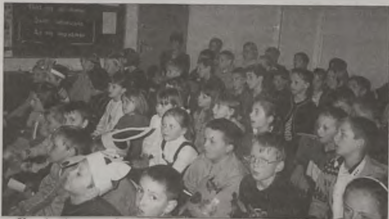
Uczniowie promujący zdrowie