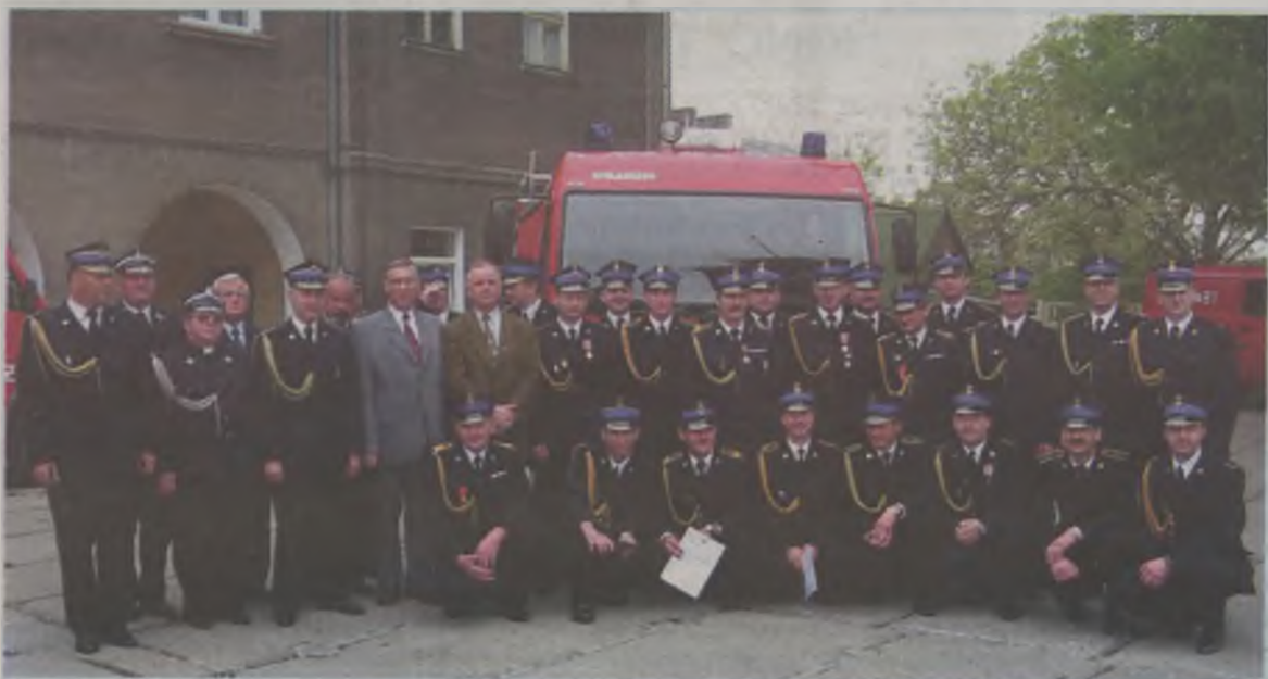
Pamiątkowe zdjęcie strażaków z Komendy Powiatowej Państwowej Straży Pożarnej w Turku i ich gości, z okazji strażackiego święta. W tle nowy pojazd samochód, jaki z okazji Dnia Strażaka otrzymała turkowska komenda.