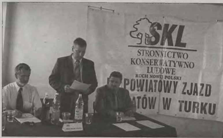
Na terenie gmin powiatu tureckiego SKL dysponuje poważnymi strukturami organizacyjnymi. Natomiast całkowita nieobecność w partii w samym Turku przekłada się na niskie notowania wśród wyborców. Czy nowym władzom powiatowym uda zmienić się dotychczasową sytuację?

ski, rocznik 1969 jest absolwentem gorzowskiej filii AWF w Poznaniu, a od 1993 roku pracuje jako nauczyciel wychowania fizycznego w turkowskim LO. Jest też aktywnym działaczem LZS. Od niedzieli, 12 maja zasiada w Wielkopolskiej Radzie politycznej SKL – RNP. aj