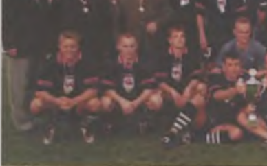
Drużyna MKS Tur Turek wygrała Puchar Polski na szczeblu Konińskim OZPN w sezonie 2002/2003

tylko z dużym spokojem zażegnał niebezpieczeństwo, ale zainicjował jeszcze indywidualną akcję zakończoną strzałem. Szkoda tylko, że nie