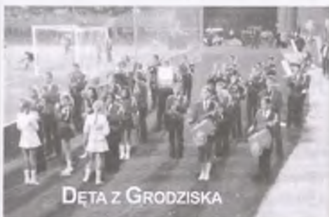
DĘTA Z GRODZISKA