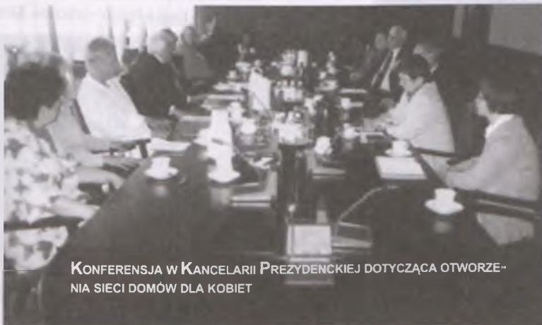
KONFERENCJA W KANCELARII PREZYDENCKIEJ DOTYCZĄCA OTWORZENIA SIECI DOMÓW DLA KOBIE

Podróżowaliśmy we czwórkę z lotniska Schiphol z Amsterdamu do Warszawy Polskimi Liniami Lotniczymi LOT. Przelot był wspaniały, a obsługa bardzo przyjazna i na bardzo wysokim poziomie.