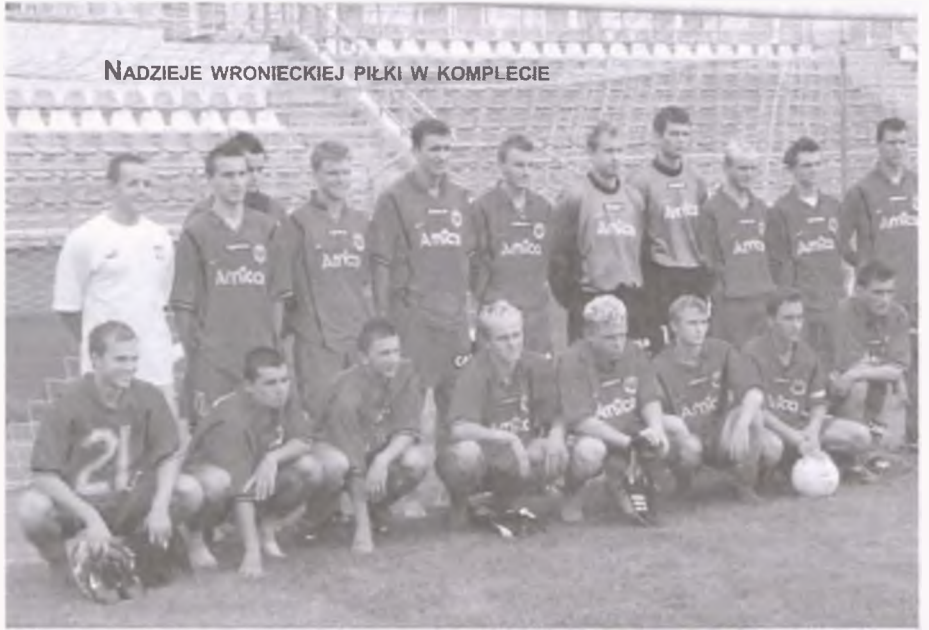
NADZIEJE WRONIECKIEJ PIŁKI W KOMPLECIE