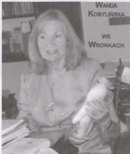
KOLEJNE ZEBRANIE KIWANIS WRONKI

„DZIECI- BEZWZGLĘDNE PIERWSZEŃSTWO” „CHILDREN PRIORITY ONE”