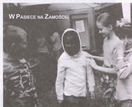
W PASIECE NA ZAMOŚCIU