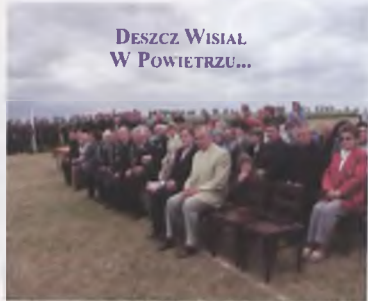
DESZCZ WISIAŁ W POWIETRZU...