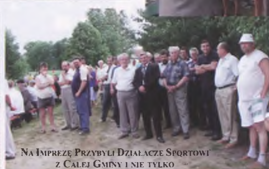
NA IMPREZĘ PRZYBYLI DZIAŁACZE SPORTOWI Z CALEJ GMINY I NIE TYLKO