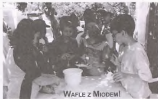
WAFLE Z MIODEM!