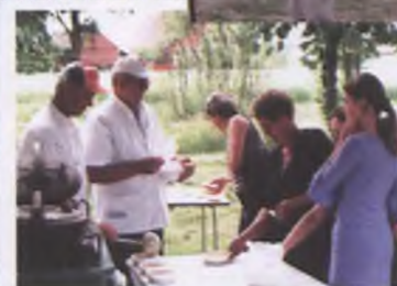
GROCHÓWKA BYŁA PYSZNA JAK ZAWSZE