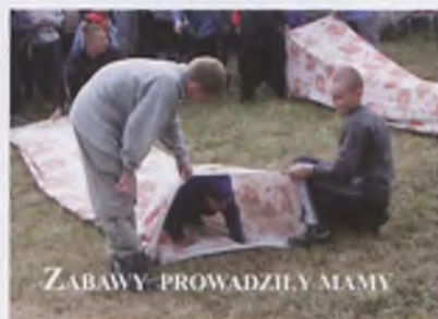
ZABAWY - PROWADZIŁY AMY