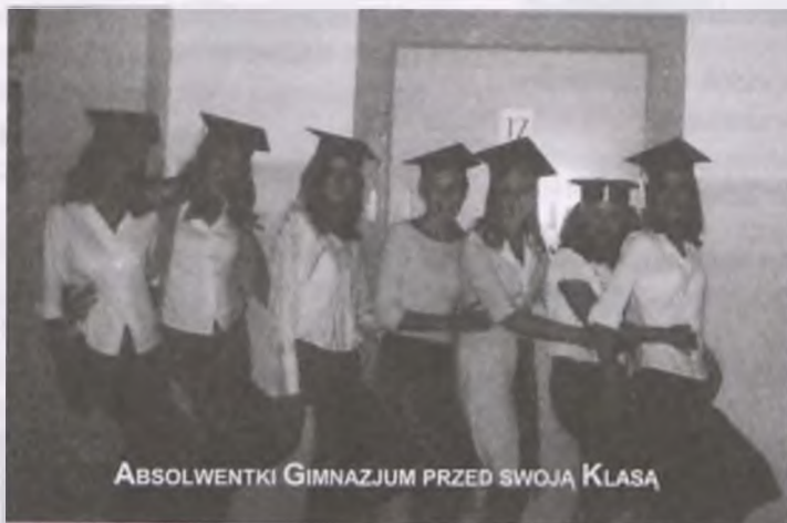
ABSOLWENTKI GIMNAZJUM PRZED SWOJĄ KLASĄ