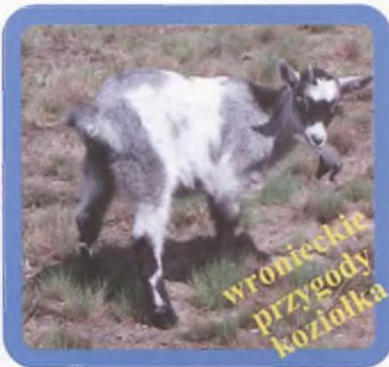
wronieckie przygody koziołka

ISSN 1231- 5680 • Rok XIV nr 25 (305) • 26.06.2003 r. • Cena: 2,00 zł (w tym 7% VAT)