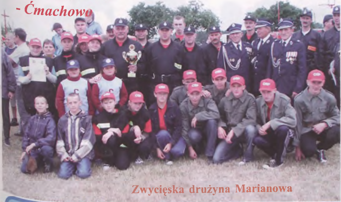
Zwycięska drużyna Marianowa