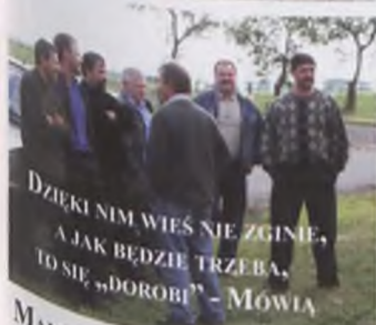
DZIEKI NIM WIĘS NIE ZGINIE, A JAK BĘDZIE TRZEBA, TO SIĘ „DOROBİ” - MÓWIA