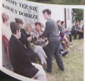
MAMY TEŻ SIĘ BAWIŁY DOBRZE