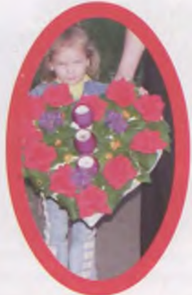
Kto miał - puszczał wianek