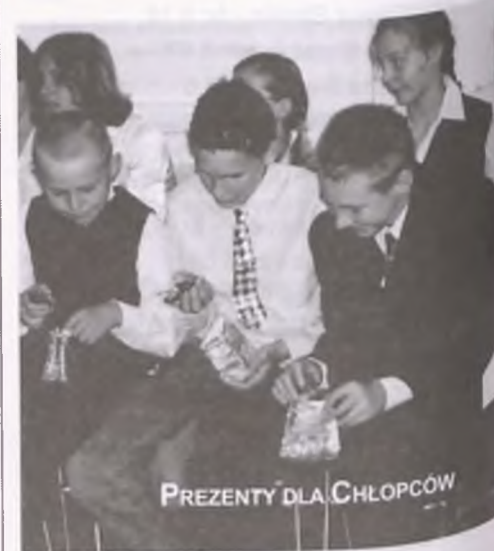
PREZENTY DLA CHŁOPCÓW