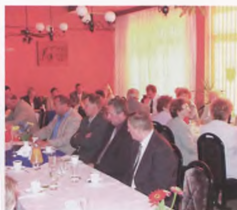
Członkowie - Delegaci na zebraniu w „Borowiance”.