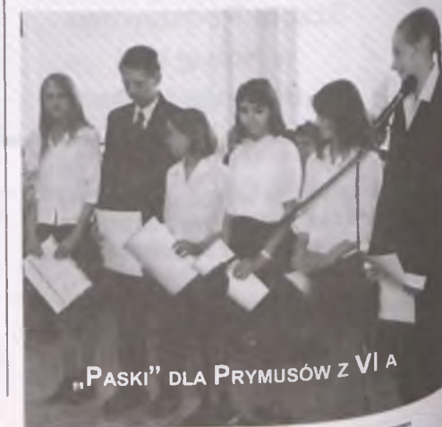
„PASKI” DLA PRYMUSÓW Z VI A