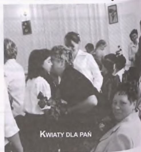
KWIATY DLA PAŃ