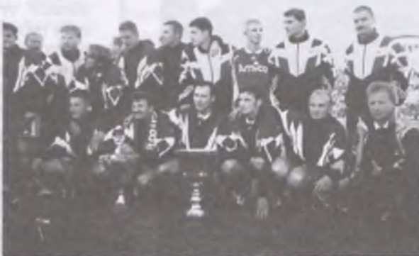
PIERWSZY PUCHAR POLSKI DLA AMIKI.

- (śmiejąc się) Gwara. Gdy słyszałem jak tutaj w sklepie mówią gwara wielkopolską, to było dla mnie coś nowego, ale po czasie przywykłem, a syn, gdy zaczął chodzić do przedszkola mówił i „zaciągał” czysto po poznańsku. Cała moja rodzina bardzo miło wspomina pobyt we Wronkach.