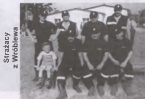
Strażacy z Wróblewa

W NIEDZIELĘ W WIELKI FINALE ZMIERZY SIĘ Z FORTUNĄ ZIELONAGÓRAA.