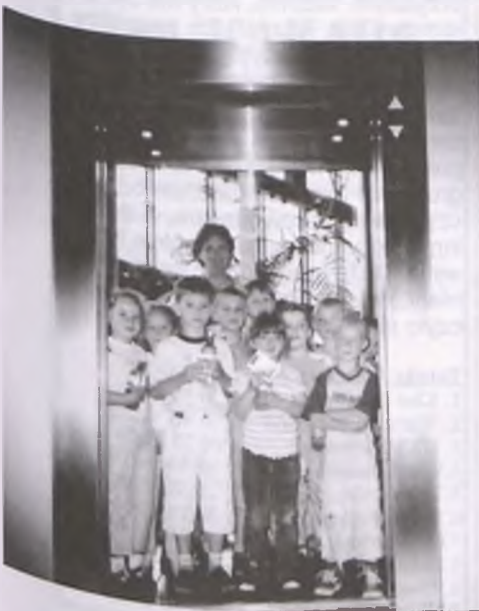
Winda była atrakcją!