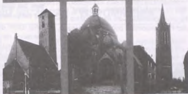
ZGODNIE ZE WKAZÓWKAMI ZEGARKA: POSIADŁOŚĆ AKERENDAM, SCHELBEECK, (PROTESTANCKI KOŚCIÓŁ) GROTE KERK, KOŚCIÓŁ ŚW. AGATY (SINT AGATHAKERK, TYLKO W BEVERWIJK) I KOŚCIÓŁ (SINT ODULFUSKERK) W WIJK AAN ZEE.

do stowarzyszenia bilardowego Carillon. W Beverwijk znajduje się więc niezliczona ilość stowarzyszeń, organizacji ochotniczych oraz klubów. Może we Wronkach są takie stowarzyszenia, które chciałyby skontaktować się z tymi w Beverwijk?