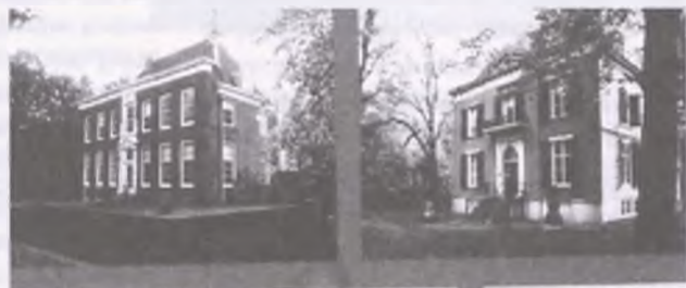
ZDJĘCIE Z LOTU PTAKA: WIJK AAN ZEE

jest bardzo bogate w Beverwijk. Od stowarzyszenia archeologicznego, poprzez Centrum dla Hiszpanów, Sint Lukasgilde (stowarzyszenie malarzy amatorów) do Grupy Teatralnej. Od Stowarzyszenia do Podtrzymania Wydm