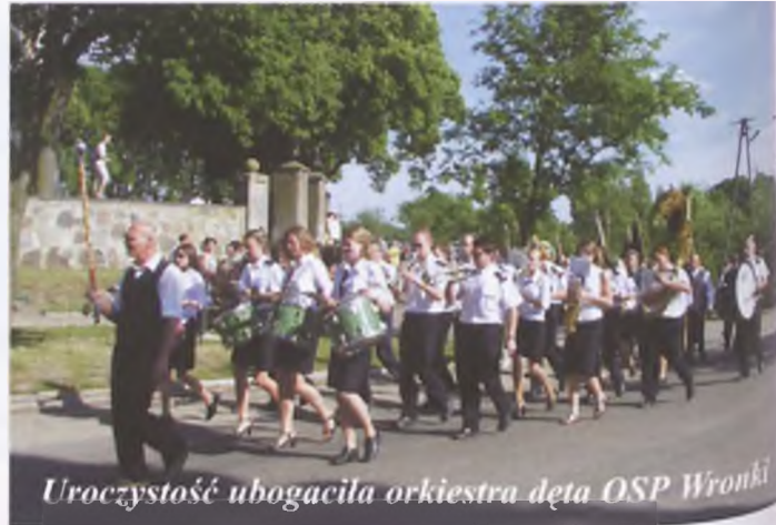
Uroczystość ubogaciła orkiestra dęta OSP Wronki

Uroczystość zakończyła się poczęstunkiem - dobrą kiełbaską, plackiem i kawą.