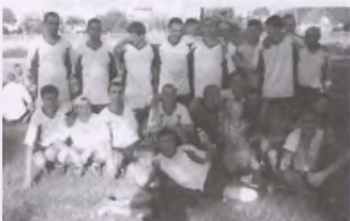
PŁOMIEŃ KŁODZISKO PO NIEZWYKLE EFEKTOWNIE WYGRNYM PÓŁFINALEZE SPARTĄ WIERZCHOCIN.

W NIEDZIELĘ W WIELKI FINALE ZMIERZY SIĘ Z FORTUNĄ ZIELONAGÓRAA.