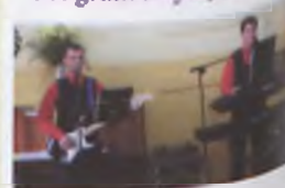
W trakcie imprezy przygrywał prawdziwy zespół