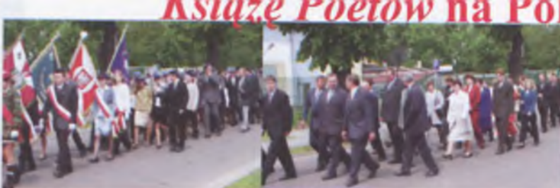
Wronki, 17 maja 2003. Uczniowie i nauczyciele gimnazjum, poczty sztandarowe i zaproszeni goście maszerują ulicami Wronek w barwnym korowodzie.