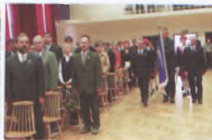
Rodzice wprowadzili na salę sztandar