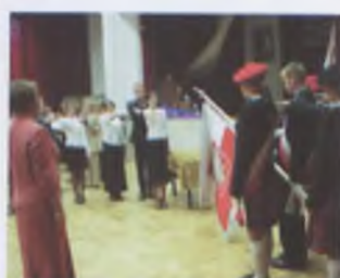
Ślubowanie uczniów na sztandar