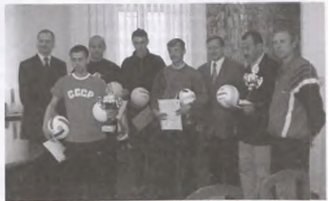
Uczestnicy spotkania z gospodarzem i gośćmi