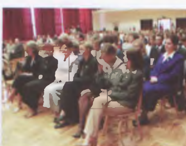
Goście nie zawiedli.