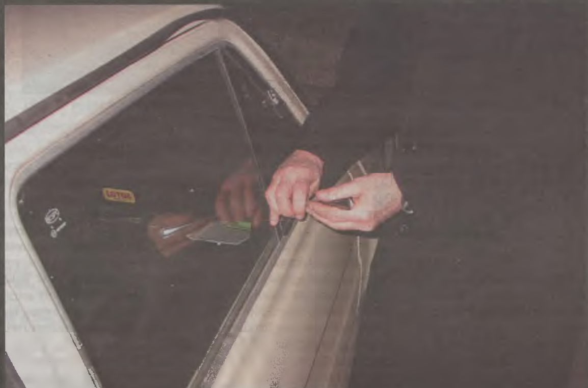
Specjalnością gangu były włamania do fiacików i polonezów

W ręce policji wpadł gang kradnący samochody. To duży sukces tureckich funkcjonariuszy, tym bardziej, że w dziupli złodziei znaleziono pięć skradzionych pojazdów.