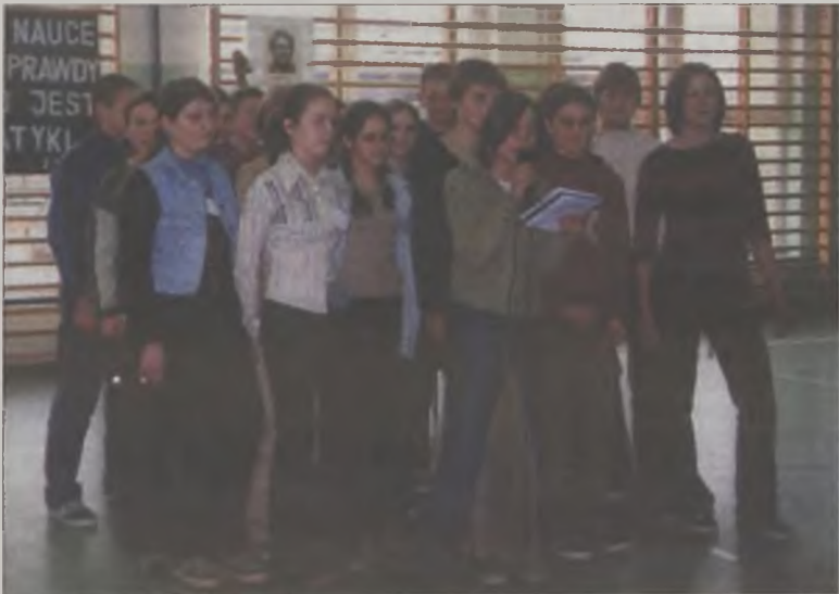
Zwycięzcy II c