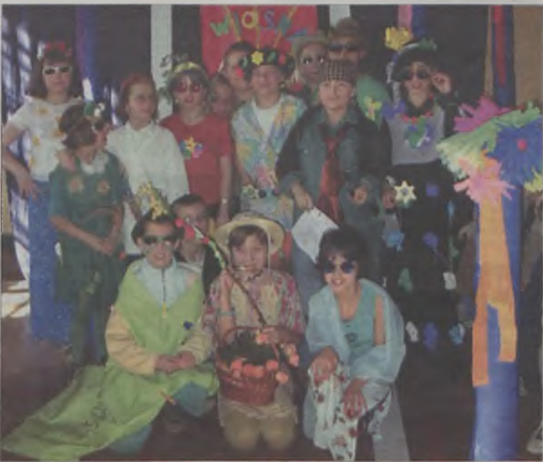
Zwycięzcy przebierańcy z klasy Ivc