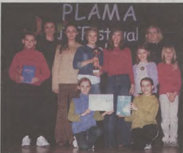
Zwycięska Szpilka z „Jedynki”

się bez modnych tego dnia przebrań i charakterystyki do znanych postaci świata filmu i codziennego życia. Na scenie panował humor i zabawa. Wielki aplauz i uznanie wywołał występ uczniów z Kaczek