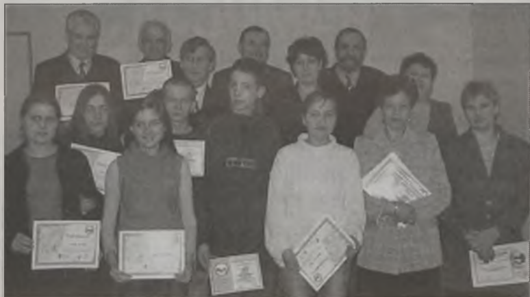
To tylko część ludzi wielkiego serca, którzy przyłączyli się do bożonarodzeniowej akcji

Wszyscy, którzy włączyli się w akcję otrzymali pisemne podziękowania z Konińskiego Banku Żywności. AZ