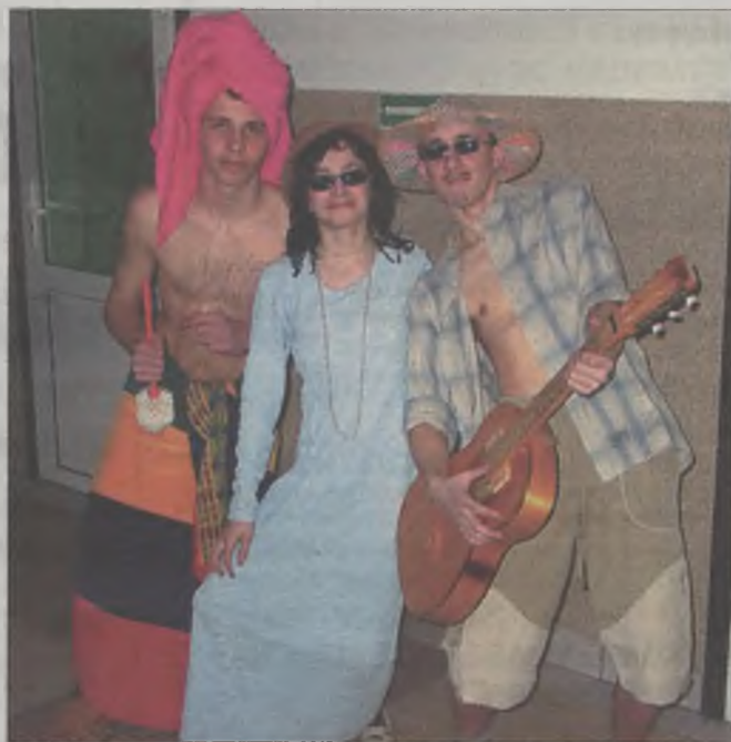
Zdobywcy nagrody publiczności w konkursie „Mini playback show”

uczniów cieszył się quiz „Najmądrzejsza klasa”. Pytania dotyczyły wiedzy, którą uczniowie zdobywają w szkole. Tytuł najmądrzejszej klasy dla swoich kolegów zdobył