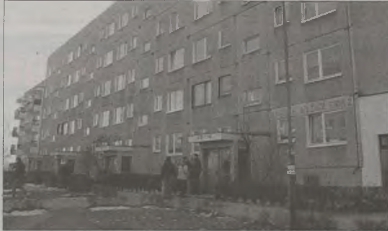
Policjanci chcą poznać problemy i potrzeby mieszkańców Osiedla Wyzwolenia w zakresie bezpieczeństwa

-Chcielibyśmy przede wszystkim rozszerzyć współpracę mieszkańców i policji w kwestii