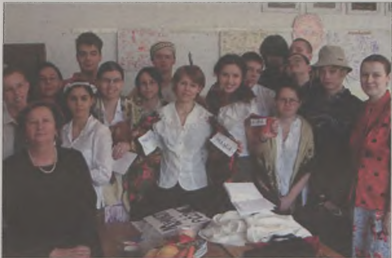
Młodzi artyści z jedną z autorek scenariusza