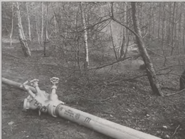
Często powodem pożaru lasów jest wypalanie traw

Ośmioosobowa reprezentacja Liceum Ogólnokształcącego w Turku w dniach od 3 do 6 kwietnia weźmie udział w Konferencji Młodzieży i Nauczycieli z Warszawy, Małych Miast i Wsi.