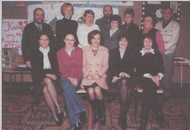
Przyszli rodzice z organizatorami szkolenia