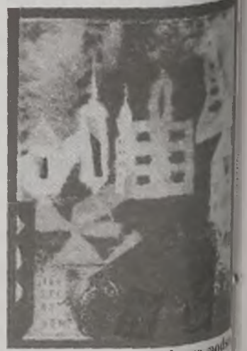
W kolorowym folderze promującym konkurs, zamieszczono prace Małgosi Wilińskiej

ly szkoły ponadgimnazjalne z terenu powiatu. Z kolei oferty turystyczne z naszego powiatu prezentowali przedstawiciele: branży hotelarskiej z Turku; Nadleśnictwa Turek, które zachęcają do skorzystania z przygotowanych pieszych i rowerowych szlaków dydaktycznych w lasach Ośrodka Wypoczynkowo-Wyglarski RAFA w Skępczynie gospodarstwa agroturystyczne w okolicach zbiornika Jeziorsko-Muzeum Rzemiosła Tkackiego Turku.