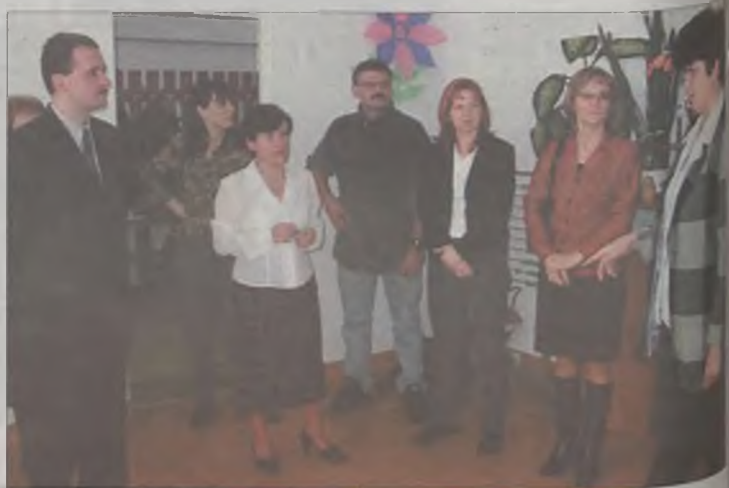
Goście podziwiali nowe i przytulne lokum

Uroczystość otwarcia w środę, 26 lutego rozpoczęła się od zwie-