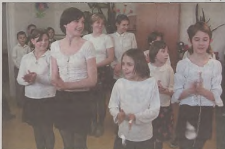
Dzieci dla swych gości przygotowały występy artystyczne

deniach nowych, kolorowych plakatów świetlicy. Z tej okazji uczęszczało wiele dla swych gości, wśród których byli przedstawiciele władz miasta i instytucji zajmujących się pomocą społeczną, przygotowujący program artystyczny.