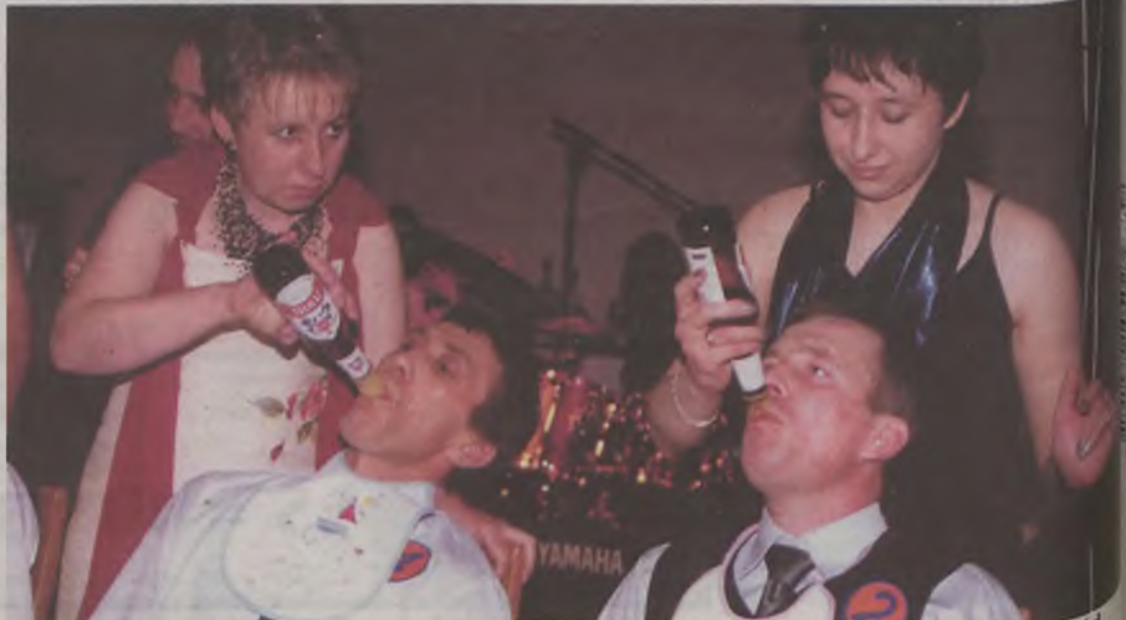
Dla uczestników licznych konkursów i zabaw przygotowano atrakcyjne nagrody. Dla tych nagród panowie gotowi byli cofnąć się do bardzo młodych lat.