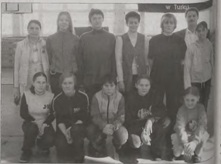
Uczestnicy turnieju tenisa stołowego