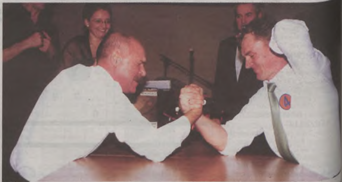
Na co dzień pracownicy nie mają okazji zmierzyć się ze swoim szefem.