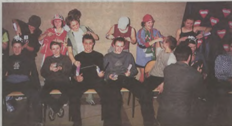
Popisy fryzjerskich mistrzów

Zbiórkę żywności dla ubogich rodzin z Turku i powiatu tureckiego przeprowadzono w minionym tygodniu w markecie InterMarche w Turku.