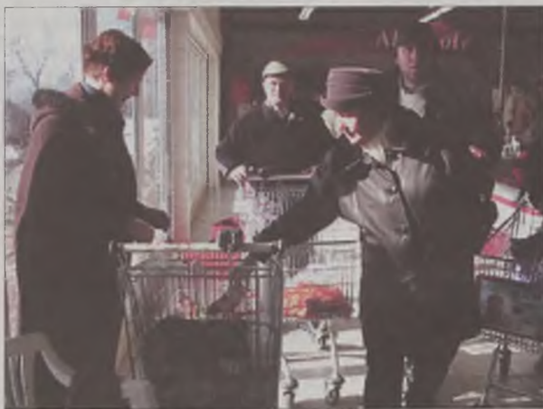
Klienci sklepu zrozumieli potrzeby najuboższych

-Chcemy serdecznie podziękować wszystkim, którzy wsparli naszą