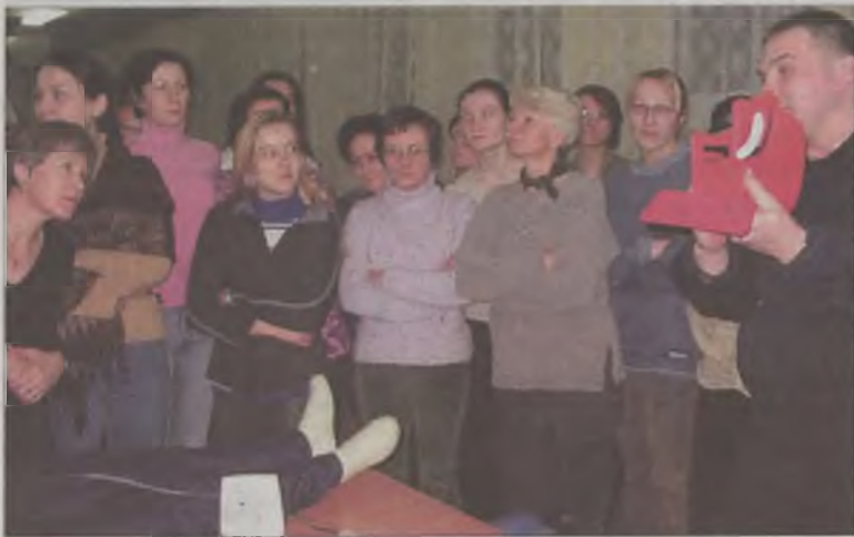
Zajęcia z ratownictwa medycznego były bardzo interesujące

Zajęcia z ratownictwa medycznego zakończyły część teoretyczną szkolenia Bezpieczna Kobieta, zorganizowanego dla blisko stu pań przez naszą redakcję, Turkowski Klub Karate i Komendę Powiatową Policji w Turku.