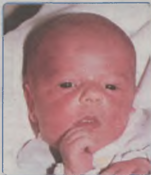
... BOROWSKA córka Iwony i Sławomira ur. 19 lutego 2003r, godz. 10.30 wżyła 3730g, mierzyła 58cm