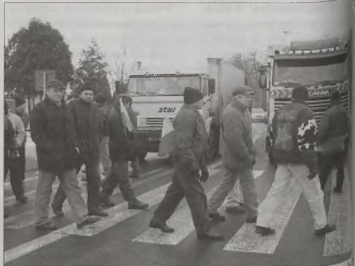
W wielu miejscowości kierowcy czekali po 20 minut na przejeździe.

-My naprawdę nie mamy bronii w walce o swój byt, a walka to skutki braku dialogu z rolnikami.