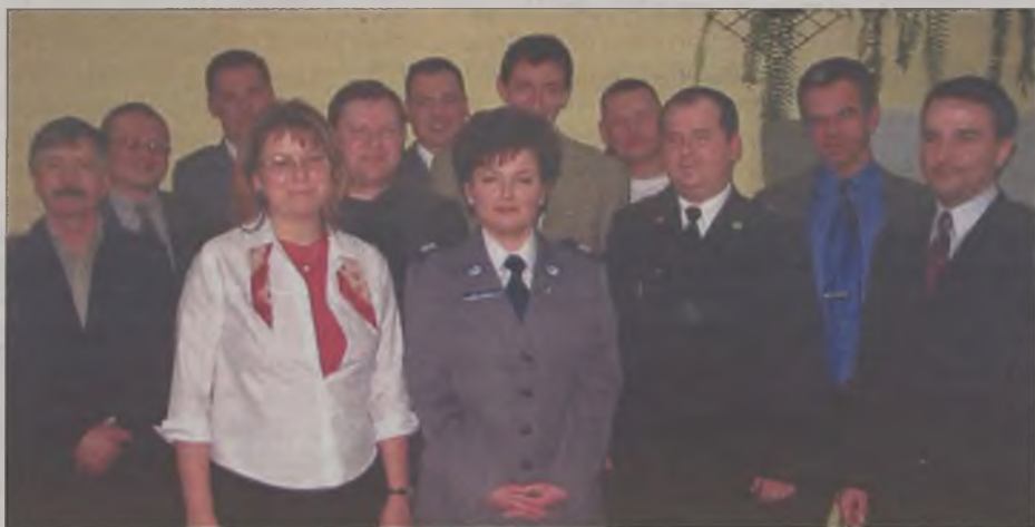
Organizatorzy szkolenia wraz z gośćmi i prelegentami