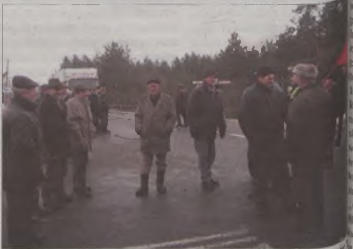
W Rzymku drogę blokowało około stu rolników, w Skęczniewie ich mniej, ale na miejsce przyjechali ciągnikami.