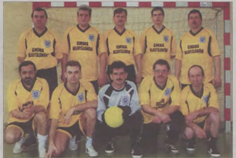
W IV Mistrzostwach Samorządowców triumfowała reprezentacja gospodarzy, czyli Władysławów, która nie bez kozery, jak zresztą na „Bogaczy” przystało, wystąpiła w złocistych koszulkach. Prawie jak Brazylijczycy.

ju i jeszcze jeden fotel do kolekcji (turystyczny) w nagrodę.