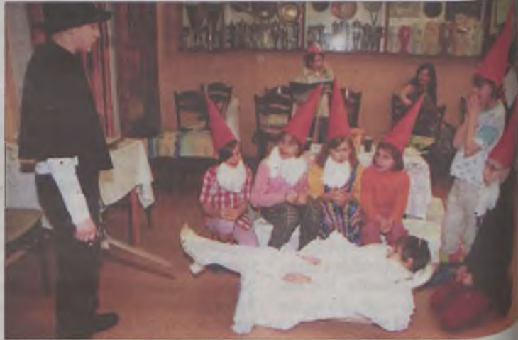
Krasnale, śnieżka i bohaterki rycerz