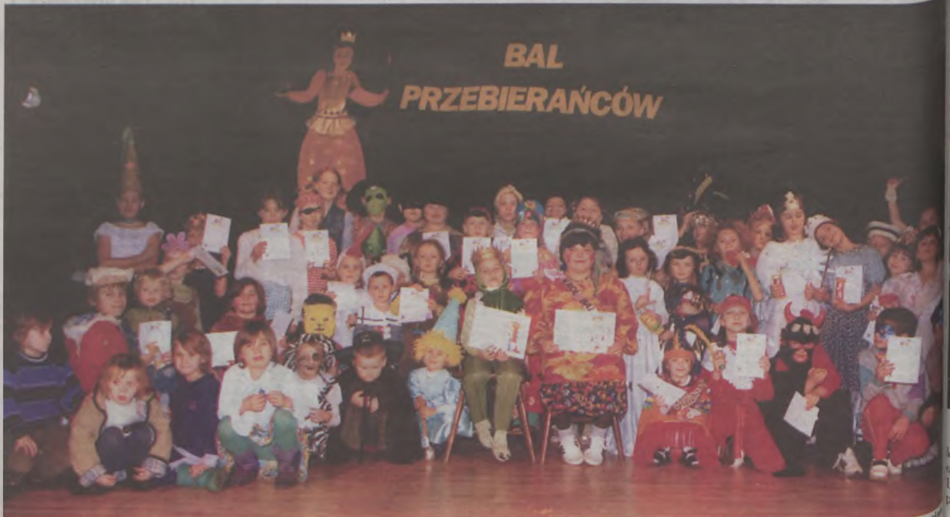
Tradycyjny Bal Przebierańców dla dzieci odbył się w ostatnią sobotę ferii w Miejskim Domu Kultury w Turku. W zabawie wzięło udział ponad 70 kolorowo ubranych dzieci, wśród których były chyba wszystkie postacie z bajek.