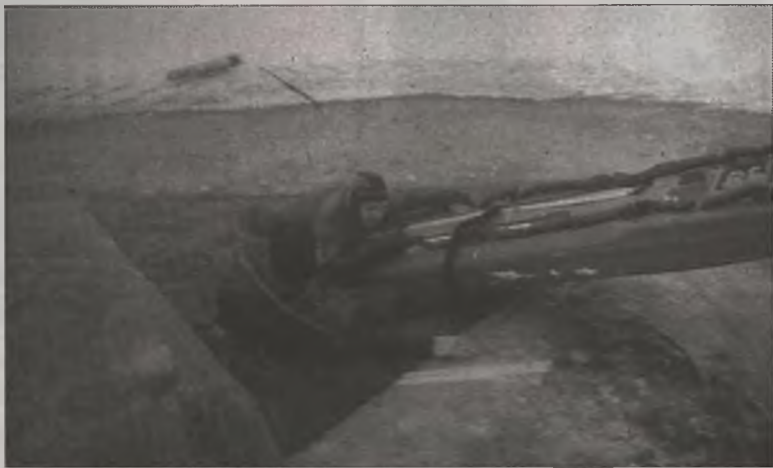
Przy pomocy deski lodowej strażacy wyłowili z wody niedoszedłego topielca

sekcja pletwonurków z Komendy Miejskiej Państwowej Straży Pożarnej w Koninie. Przybyli pletwonurkowie przeszukali dno zbiornika w miejscu prowadzonej wcześniej akcji ratunkowej. Nikogo więcej nie znaleziono.