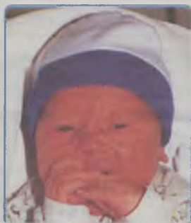
... STRZELECKI syn Ewy i Krzysztofa ur. 1 lutego 2003 r, godz. 3.10 wazył 3870g, mierzył 58cm