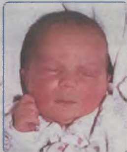
... MATUSZAK córka Ewy i Krzysztofa ur. 7 stycznia 2003r, godz. 20.25 wazyła 3740g, mierzyła 53cm