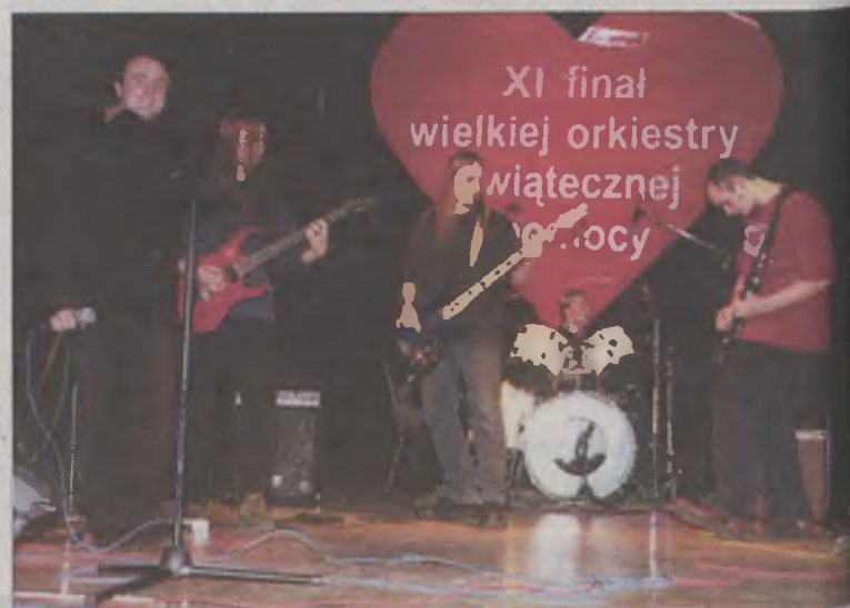
Na scenie domu kultury wystąpiły zespoły prezentujące różne style muzyczne