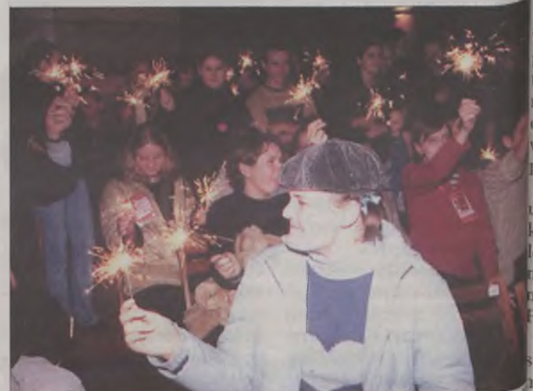
Jak zwykle o dwudziestą uczestnicy tegorocznego Finału zapalili tradycyjne „Światelko do nieba”.