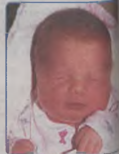
... ŁUKASZEWSKI syn Katarzyny i Krzysztofa ur. 9 stycznia 2003r, godz. 14.15 wazył 3250g, mierzył 52cm