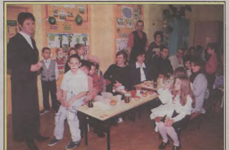
Zabawy choinkowe odbyły się w miniony czwartek i piątek (9 i 10 stycznia) w Szkole Podstawowej nr 5 w Turku. Dzieci z tej okazji przygotowały występy jasełkowe oraz szopkę noworoczną. Po występach, które obejrzel rodzice, odbyła się dyskoteka. AZ