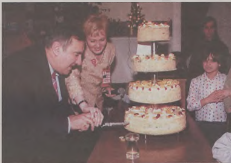
Tort po pokrojeniu trafił do wolontariuszy