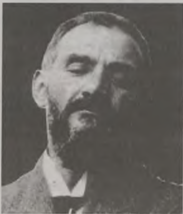
Urodzony w Turku Henryk Glicenstein należy do grona najsłynniejszych światowych artystów

Rodzice uważali Henocha za trudne i różniące się od innych dziecko i nie rozumieli początkowo jego we-