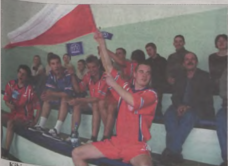
Kibice emocjonalnie wspierali swych faworytów