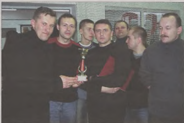
Drużyna policjantów zdobyły przez siebie puchar odkupiła na licytacji