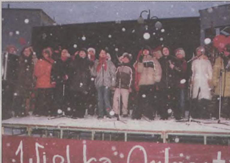
Śnieżycy absolutnie nie przeszkadzała młodym turkowie w występach na rzecz Fundacji Jurka Owsia

Domu Kultury. Tutaj, jak już wcześniej informowaliśmy, głównym licytowanym, gadżetem było „Tur-