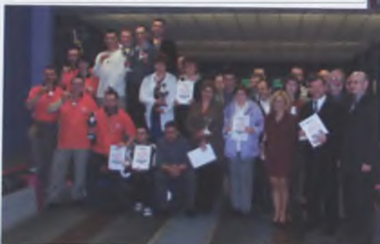
Zwycięzcy - AMICA I

W ostatnią sobotę marca we wronieckiej kręgielni podsumowano rozgrywki Ligi Zakładów Pracy.