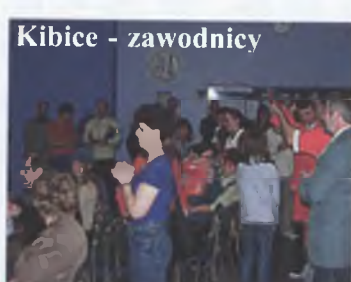
Kibice - zawodnicy