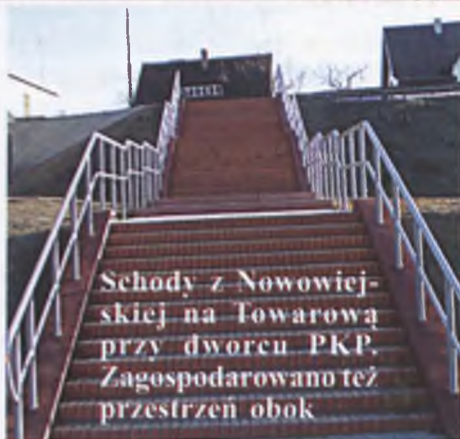
Schody z Nowowiejskiej na Towarową przy dworcu PKP. Zagospodarowano też przestrzeń obok

Przyszła wiosna, stopniały śniegi i odkryły gołą prawdę o naszym mieście. Oto kilka migawek - miejsc, które widzi każdy - bez zagłębiania się w zaułki. Dla równowagi - kilka widoczków ładnych i brzydkich.