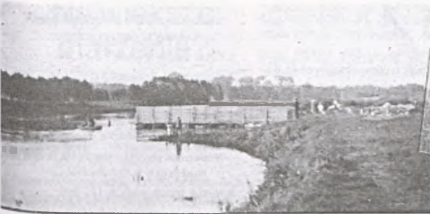
Łazienki na rzece Warcie we Wronkach (1929r.). Kąpielisko na małej plaży (przy cegielni na Borku) było obite z 3 stron deskami, które uniemożliwiały wejście na głęboką wodę.

Zdjęcie przedstawia rzekę Wartę na wysokości obecnego Osiedla Słowackiego we Wronkach (1929r.).