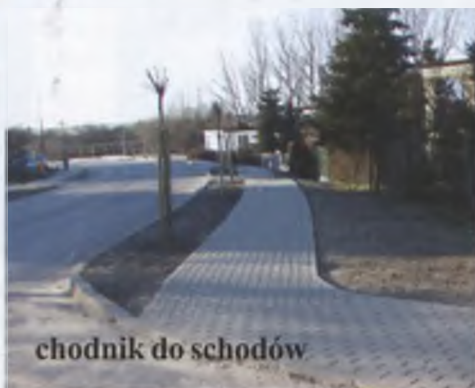
chodnik do schodów