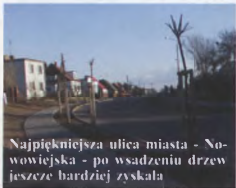
Najpiękniejsza ulica miasta - Nowowiejska - po wsadzeniu drzew jeszcze bardziej zyskała