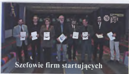
Szefowie firm startujących