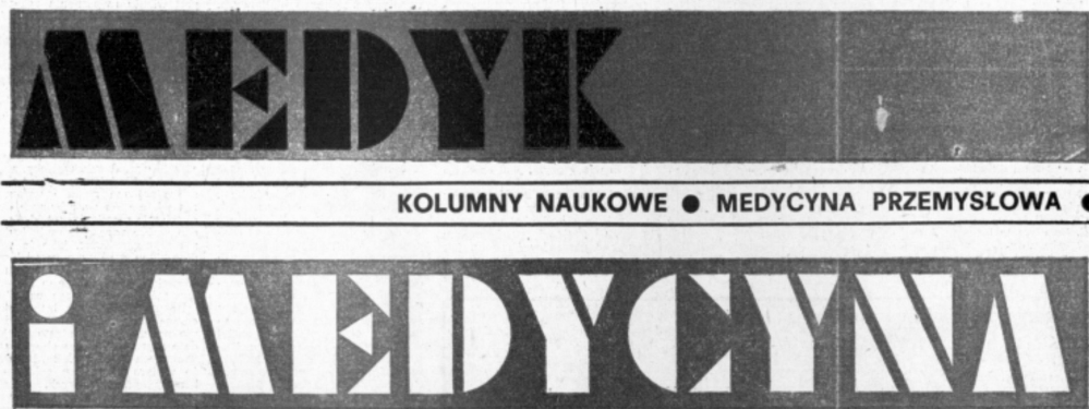
Rycina 8. Strona tytułowa czasopisma Medyk i Medycyna – kolumny naukowe