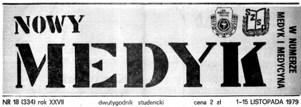
Rycina 4. Strona tytułowa czasopisma „Nowy Medyk” z 1979 roku