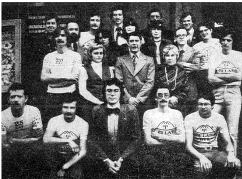
Rycina 7. Redakcja warszawska (1978)