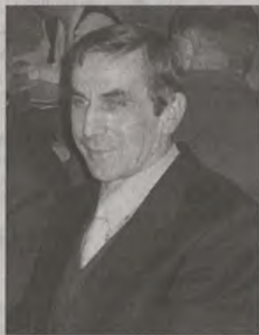
Rady Kulig uważa, że wynagrodzenie burmistrza nadal jest zbyt wysokie