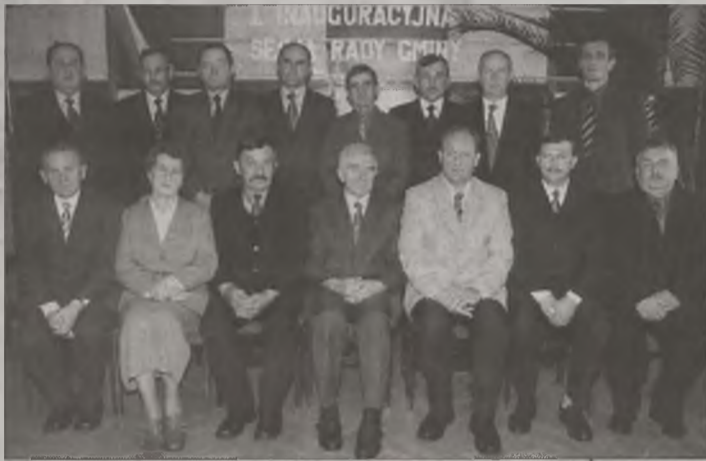
Samorządowcy gminy Kawęczyn

ności. Zaznaczył jednak, że wiele zależy od zasobności gminnej kasy. Mówił też o perspektywach stojących przed gminą w obliczu przystąpienia Polski do Unii Europejskiej.