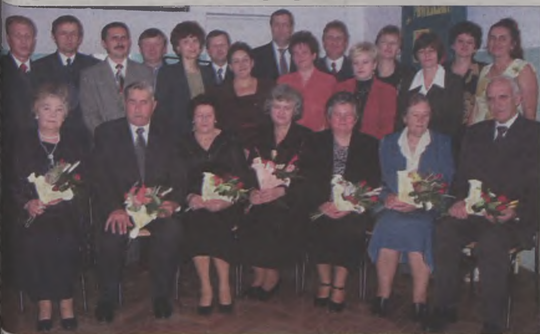
absolwenci podstawówki ze swoimi pedagogami

„Dni, są ludzie, są miejsca, do których powracamy” – takie hasło wieszało absolwentom Szkoły Podstawowej w Koźminie, którzy w sobotę, 23 listopada spotkali się w zjeździe, po 25 latach ukończenia szkoły.