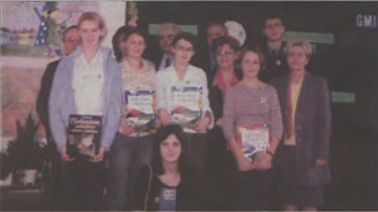
Finaliści z Gimnazjum w Żukach razem z gośćmi

Jak się okazało, we wszystkich szkołach na terenie gminy Turek popularyzuje się odzysk i recykling puszek aluminiowych. Dzieje się to we współpracy z fundacją „Recal”.