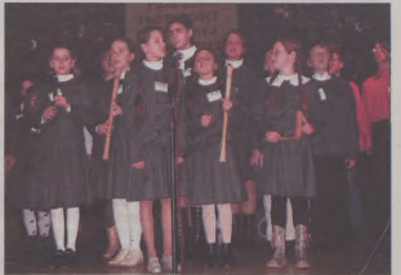
Na scenie pojawiły się również śpiewające, niewidome dzieci

Przeгляд z roku na rok sprowadza do Turku niewidomych lub niedowidzących artystów. Jeszcze kilka lat temu byli to mieszkańcy Wielkopolski, w tym roku na scenie prezentowali się muzycy nawet z Lublina. Turkowskie prezentacje twórczości to nie tylko konkurs o nagrodę burmistrza. To także sposób na wymianę doświadczeń pomiędzy wykonawcami oraz wspólne biesiadowanie i śpiewanie z artystami. Pokrzywdzeni przez los artyści odczuwają wielką radość z możliwości pokazania publiczności swojego dorobku artystycznego.