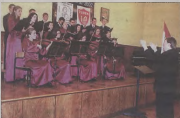
„Canticum” z Kalisza