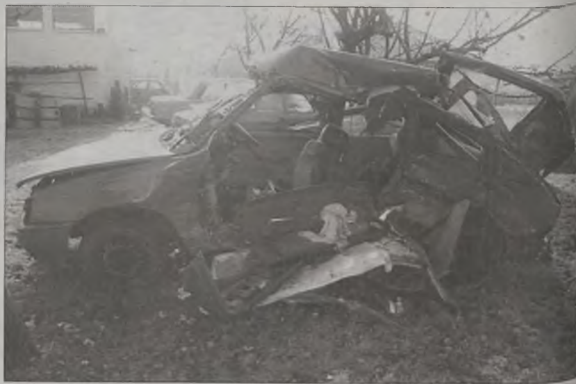
Kierowca i pasażerka tego Opla zginęli na miejscu wypadku

Przypomnijmy, że z nieustalonych przyczyn doszło do zderzenia dwóch samochodów: Opla Kadetta i Fiata Siena. W wyniku zderzenia śmierć na miejscu poniosło dwoje młodych ludzi: 23-letni kierowca Opla i jego 20-letnia pasażerka. Wszystkie osoby, które były świadkami wypadku proszone są o kontakt z policją w Turku pod numerami telefonów: 289-81-00, 997, z telefonów komórkowych 112, lub z funkcjonariuszem prowadzącym sprawę - tel. 289-81-28.