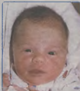
... DZWONIAREK syn Beaty i Leszka ur. 16 listopada, godz. 6.50 ważył 2950g, mierzył 52cm