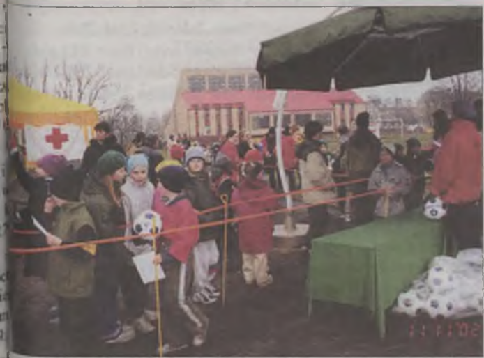
Najlepsze miejsce nagradzane było piłką

Legion główny (115 osób) 3000 m 1. Dłubalska - Olimpia Poznań 2. Lewandowska - RKS Łódź 3. Jarosz - Śląsk Wrocław 6000 m 1. Kruczkowski - Zawisza 2. Burghardt - LKS Mielec 3. Kępiński - Płock Maraton 1. Panfil - Maraton Turek Najlepsza zawodniczka: Elżbieta Kołaczkowo (1954 r.) Najlepszy zawodnik: Eugeniusz Si- Koło (1934 r.) Kategoria niepełnosprawnych 1. Dul - Głucholazy 2. Dziedzic - Kalisz 3. Gnasiak - Zduńska Wola Legion (693 uczniów) (roc. 1987) 1. dziewczęta 2. Lewandowska - Orchowo 3. Walczak - G 1 Turek 4. Szucha - Budziszław 5. chłopcy 6. Gmerek - Nowe Skalmierzyce