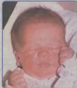
... WITUŁA syn Iwony i Zbigniewa ur. 11 listopada, godz. 13.30 ważył 3400g, mierzył 52cm