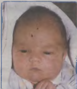
... KRAWCZYK córka Iwony i Marka ur. 15 listopada, godz. 10.20 ważyła 3940g, mierzyła 57cm