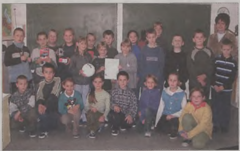
Nagrodzona klasa IIIa