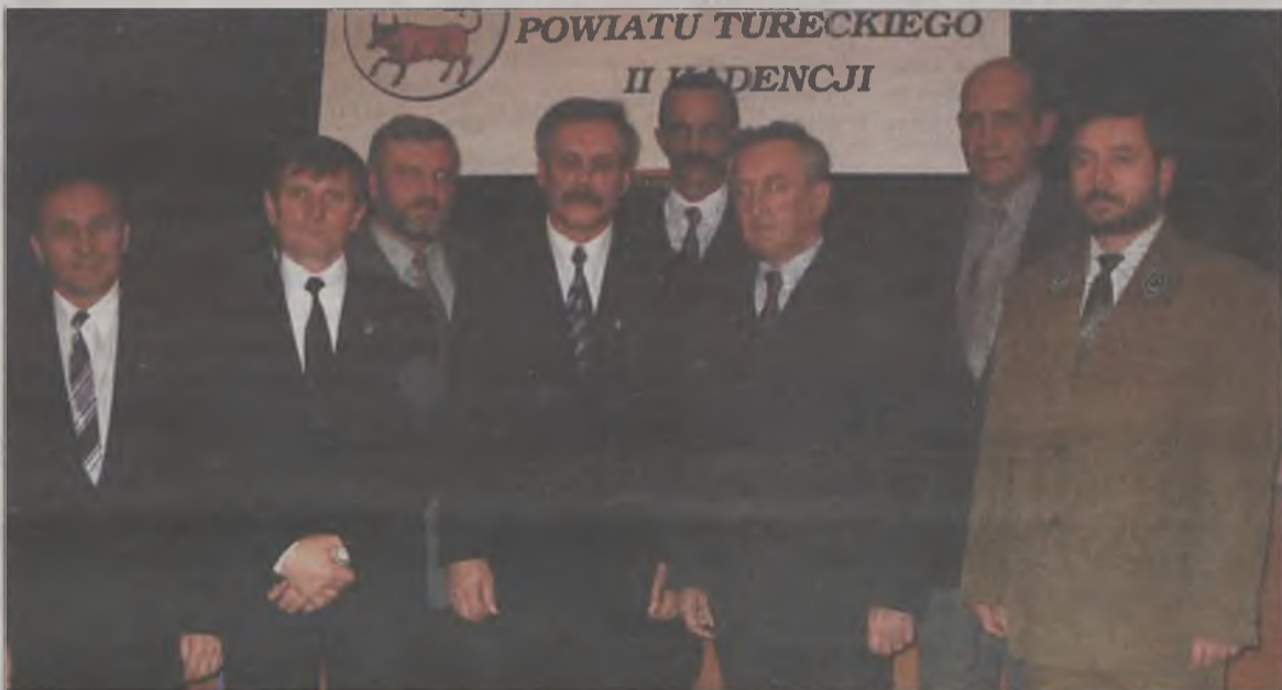
Do prezydium Rady Powiatu i w skład jego zarządu weszli przedstawiciele koalicji złożonej z Towarzystwa Samorządowego, Samoobrony RP i Polskiego Stronnictwa Ludowego. Na razie poza tą układanką znalazł się Sojusz Lewicy Demokratycznej. Czy ten układ będzie obowiązywał już do końca kadencji? Oto jest pytanie.