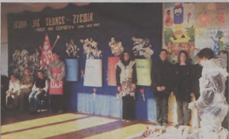
Przedstawienie „Dziady ekologiczne czyli rzecz o recyklingu” w wykonaniu gimnazjalistów z kl. II d