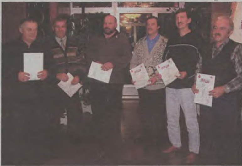
Wyróżnieni dyplomem za wieloletnie oddawanie krwi