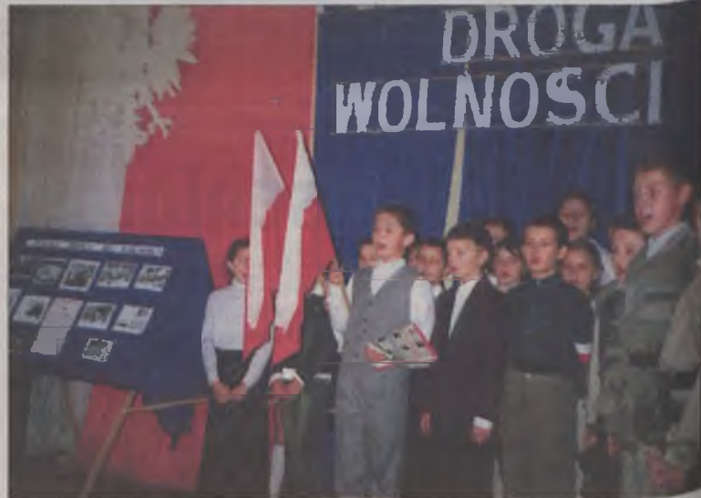
Opowieść o drodze do wolności w wykonaniu uczniów kl. IVa i IVb

W dniu 8 listopada uczniowie i nauczyciele Szkoły Podstawowej w Słodkowie uczcili Święto Niepodległości. Z tej okazji odbył się uroczysty apel, rozpoczęty przez przewodniczącą samorządu uczniowskiego.