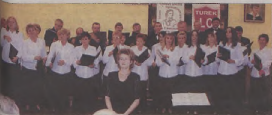
Chór Nauczycielski z Turku