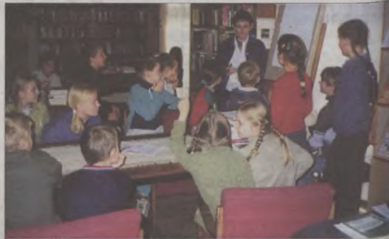
Wizyta w Gminnej Bibliotece