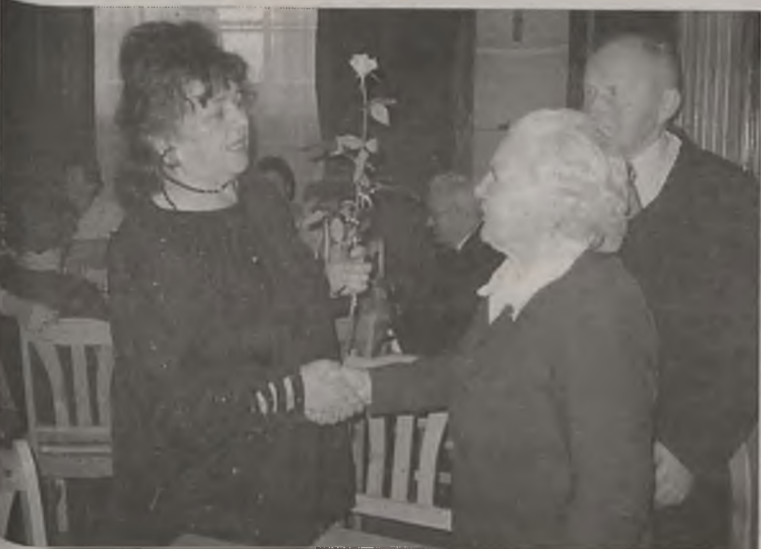
Kwiatki dla najstarszych seniorów

W działającym od szesnastu lat Klubie Seniora we Władysławowie skupionych jest około 60 starszych mieszkańców gminy, którzy wspólnie się bawią, wyjeżdżając na wycieczki i pielgrzymki, występując na wielkopolskich scenach czy obchodząc np. „Mieniny miesiąca”. AZ