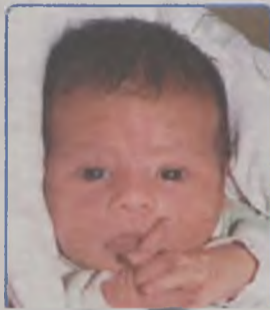
...KOLAŃSKA córka Arlety i Jerzego ur. 13 listopada, godz. 21.55 ważyła 3500g, mierzyła 54cm