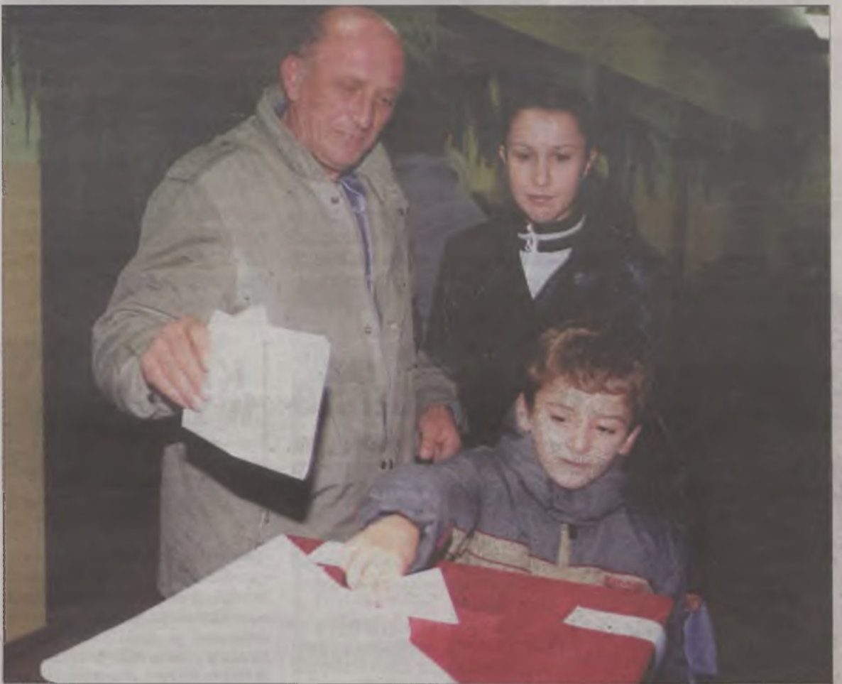
W głosowaniu turkowiacy dali wyraz swemu pragnieniu powrotu do normalności

Przed Sądem Okręgowym w Koninie rozpoczął się proces 22-letniego mieszkańca Tarnowej w gminie Brudzew, podejrzanego o podpalanie lasów. Mężczyzna został zatrzymany w maju tego roku i podczas przesłuchań przyznał się do podpalenia.