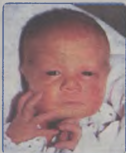
... FRANKOWSKA córka Danuty i Piotra ur. 14 października, godz. 10.05 wazyła 3000g, mierzyła 50cm