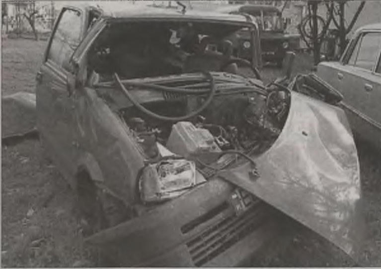
Kierowca tak zmasakrowanego auta nie miał szans na przeżycie

Policja turkowska poszukuje świadków wypadku, jaki miał miejsce w piątek, 25 października o godz. 16.50 na Obwodnicy Północnej w Turku. W wyniku poniesionych obrażeń zmarł 35-letni mężczyzna.