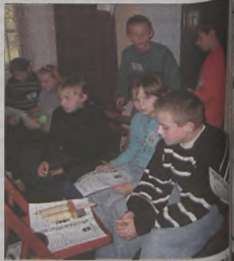
Dzieciaki w Tuliszkowie zawsze dobrze się bawią.

Organizatorami corocznych spotkań są: Dom Dziecka „Oaza” w Nowym Świecie, Miejsko-Gminny Ośrodek Kultury w Tuliszkowie oraz Centrum Kultury i Sztuki w Koninie. Jak podkreślają organizatorzy, Artystyczne Spotkania zrodziły się z potrzeby podzielenia się tym, czym żyją domy dziecka i co przeżywają ich wychowankowie. Bo impreza w Tuliszkowie to nie tylko okazja do zaprezentowania własnego dorobku artystycz-