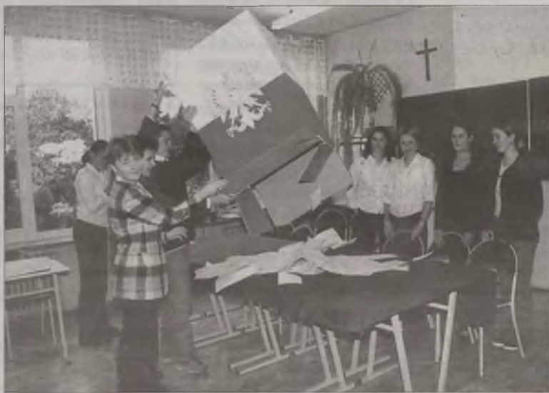
Komisja przy pracy

W prawyborach do Rady Gminy największe poparcie w granicach 25