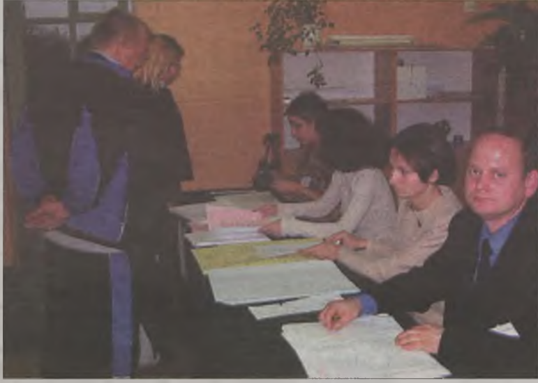
Aż 57 procent wyborców chciało, by burmistrzem miasta był Zdzisław Czapla