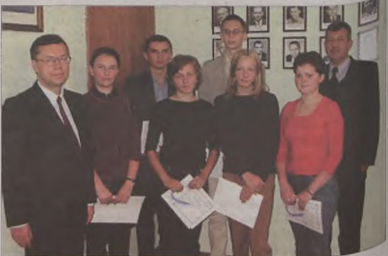
... i z Liceum w Turku