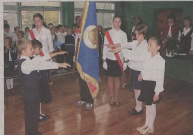
Pierwszaki ślubowały na sztandar szkoły