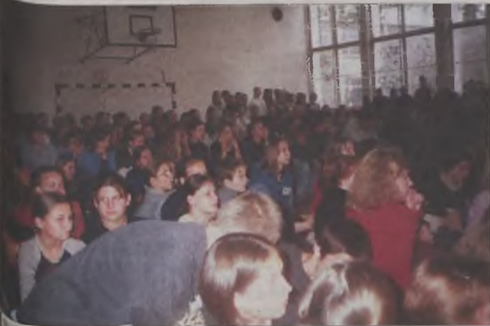
Wyborcy podczas debaty kandydatów