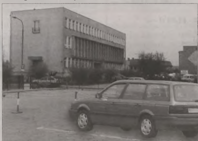
Czy z powodu kołpaków do volkswagena passata właściciel będzie musiał odpowiadać przed sądem?

w Koninie, a następnie sprawę przekazano do Koła. Po publikacjach w prasie, dotyczących związków policjanta z Turku z jednym z kolskich prokuratorów, śledztwo wróciło do Konina.