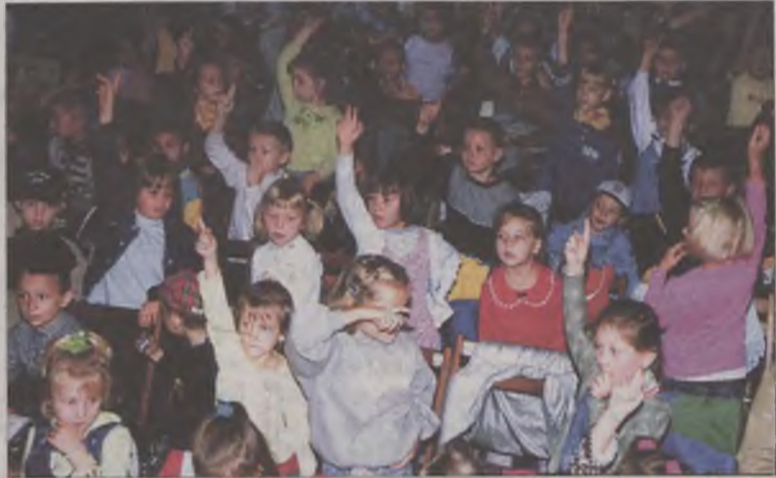
Dzieciaki chętnie zgłaszały się do udziału w zabawach na scenie