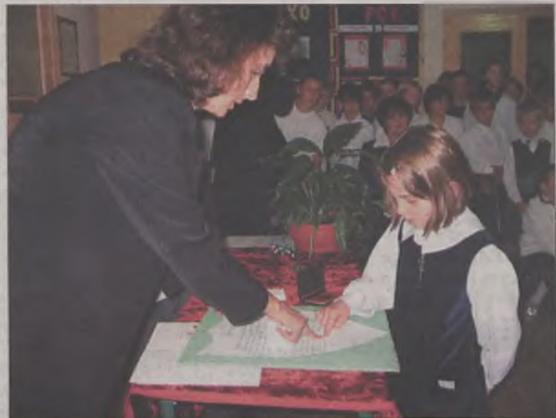
Dzieci odciskaniem palca przypieczętowały swoją uczniowską przysięgę

Dzieci z klasy II wręczyły pierwszacom upominki, a klasa VI przygotowała część artystyczną. Swoją występowanie na powitanie szkoły mieli również nowo mianowani