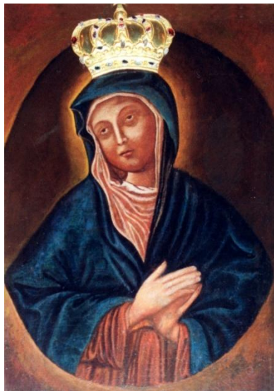
Matka Boska z Monasterzysk do 1945 r. (z lewej) i obecnie