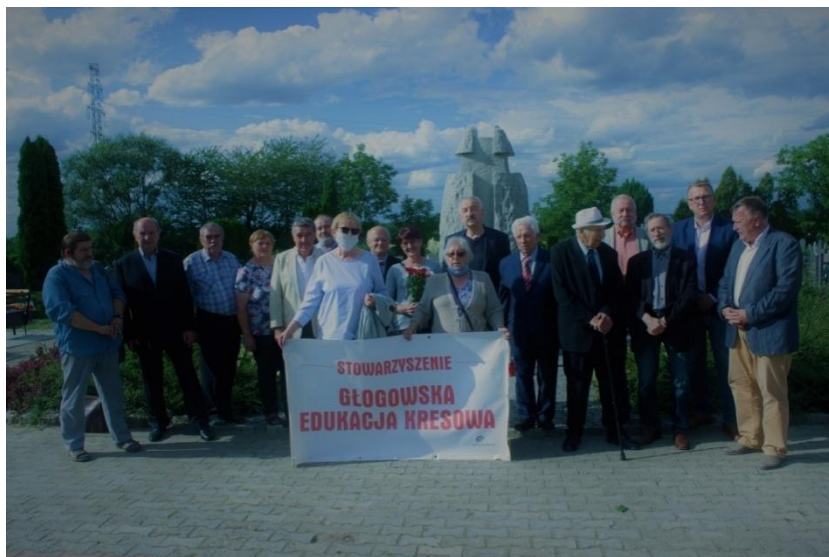
Członkowie stowarzyszenia „Głogowska Edukacja Kresowa” po uroczystościach