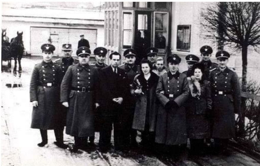
podpisane „Niemieccy zbrodniarze z Czorkowa”