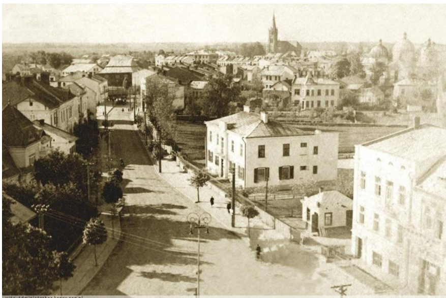
Kamionka Strumiłowa w latach 20. XX wieku

że mieszkaliśmy jak na wysepce wśród morza Rusinów i to w samym środku przedmieścia.