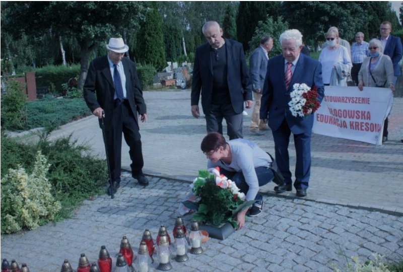
Uroczyste złożenie wiązanki kwiatów pod pomnikiem