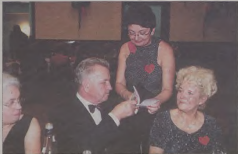
Na Balu Jubileuszowym absolwenci nader ochoczo sięgali do swoich portfeli co w efekcie zwiększy szanse zainstalowania klimatyzacji w szkolnej auli.