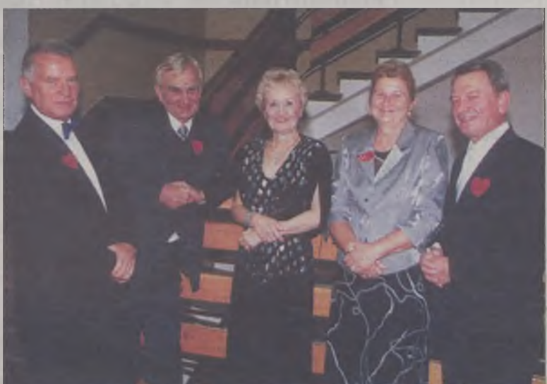
Absolwenci z dumą prezentowali „serca” z deklaracją „Kocham Liceum”

Tegoroczny, IV zjazd wychowanków gimnazjum i liceum w Turku stanowi kontynuację poprzednich trzech tego typu przedsięwzięć organizowanych kolejno w latach: 1932 (dwudziestolecie powstania szkoły), 1962 (pięćdziesięciolecie) i 1992