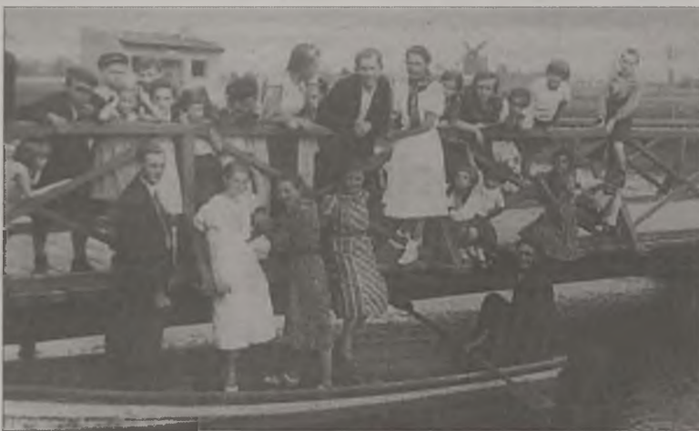
Wypoczynek w parku miejskim

Duże zaangażowanie wykazał premier przy pracach związanych z budową nowego gmachu gimnazjum wizytując kilkakrotnie plac budowy. Pod jego czujnym okiem imponujący gmach wybudowano w