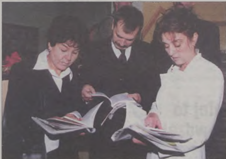
Najbardziej pasjonującym momentem Zjazdu było dla wielu jego uczestników odnalezienie swoich nazwisk we właściwym roczniku maturalnym.