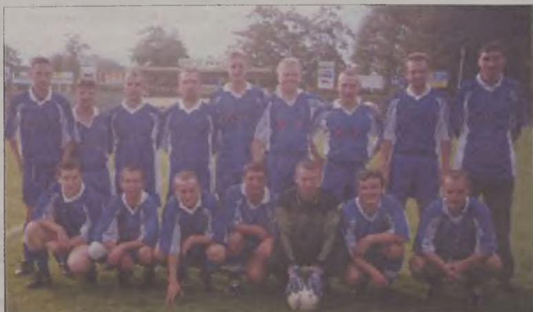
Zwycięzcy turnieju, piłkarze PROFIm Turek