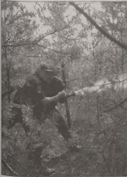
Strażacy w walce z żywiołem

Około 15 hektarów spalonych lasów to efekt zaledwie dziewięciodniowej działalności piromanów. Strażacy ogień w lasach gasili codziennie.