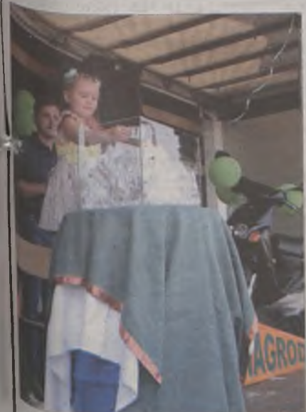
Decydujący moment – „sierotka” losująca zwyciężcę nagrody głównej – skutera