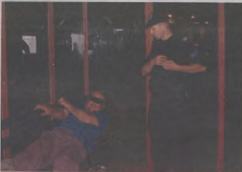
Nie wolno spać na przystanku. Policjanci budzą bezdomnego

zwłaszcza tym ostatnim zarzutem. O ile wiem to właśnie z pieniędzy podatników miasto musi płacić za pobyt w Izbie takich jak on. A swoją drogą, to czy przy pogotowiu w Turku nie mogłaby powstać izba wyrzężeń? Lekarze w pogotowiu i tak mają dyżury. Doszłoby jedynie zatrudnienie pielęgniarzy, ale odeszły koszty transportu do Konina i stracony czas policjantów.