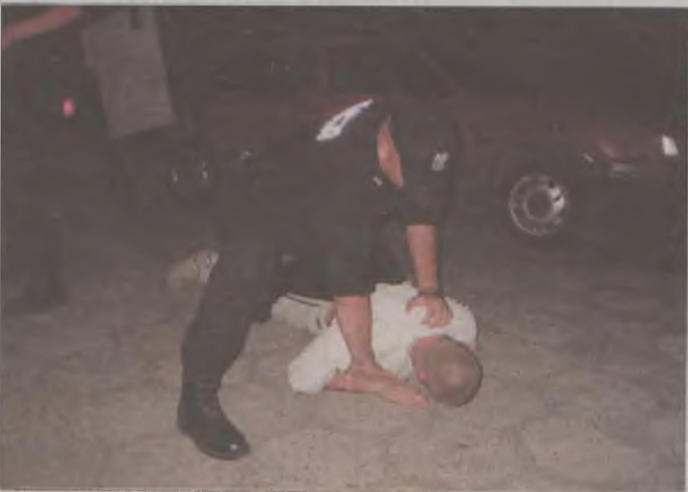
Pijany mężczyzna nie chciał wejść do radiowozu, kładł się na chodniku. Policjanci musieli mu „pomóc”

Jedziemy bardzo wolno. Mijamy grupy młodych ludzi. Na Kączkowskiego zauważamy auto jadące bez świateł. Zatrzymany