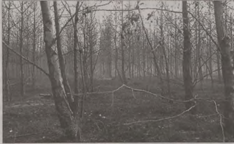
Tak wygląda las po przejściu ognia. Aby się odrodził, trzeba wiele pracy i długich lat

Pod koniec ubiegłego tygodnia piroman uaktywnił się również w gminie Dobra. W czwartek, 29 sierpnia ktoś zaprószył ogień w środku lasu. Spalił się jeden ar. Niedługo potem, w miejscowości Żechta oddalonej o około 1 km również powstał pożar. Następnego dnia w Rzymsku (także w gminie Dobra) ktoś podpalił las. Spalił się 1 ar poszycia leśnego.