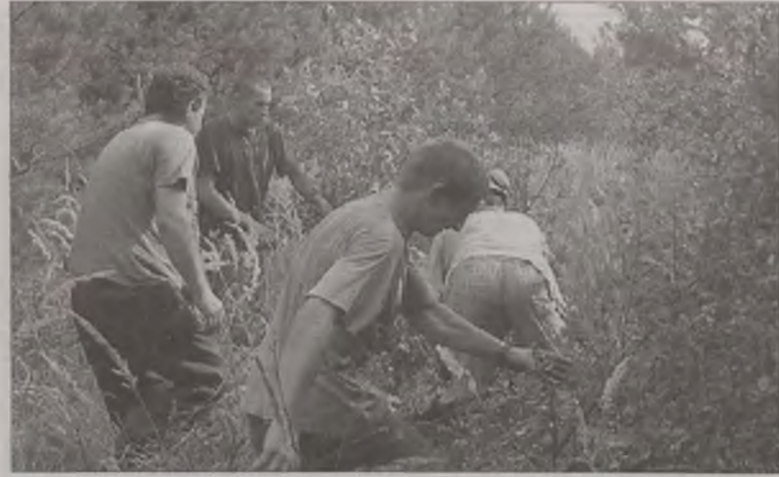
Leśnicy w nadzwyczaj szybkim tempie ścinają drzewa, aby ogień nie rozprzestrzenił się na resztę lasu

-Wszystkie te pożary to prawdopodobnie sprawa podpalacza. Ogień jest wzniecony między godziną 14.00 a 16.00, czasem w kilku miejscach oddalonych od siebie i kilkaset metrów. Można przypuszczać, że to mieszkaniowiec z okolicznych miejscowości, gdyż wszystkie miejsca, gdzie były pożary oddalone są od siebie o trzy i pół do czterech kilometrów – mówi młodszy kapitan Wojciech Pasik z Komendy Powiatowej Państwowej Straży Pożarnej w Turku. W walce z ogniem w lasach poza PSP walczyły również jednostki Ochotniczej Straży Pożarnej, m.in. z Przykony, Brudzewa, Smulska i Radyczyn.