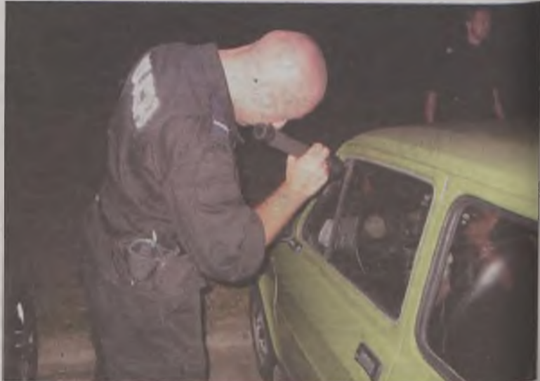
Nikt nie widział, jak włamywacz kradł radio z tego fiata

cji. Możliwość jazdy, czasami szybkiej jazdy. Nie zamieniłbym tej pracy na żadną inną.