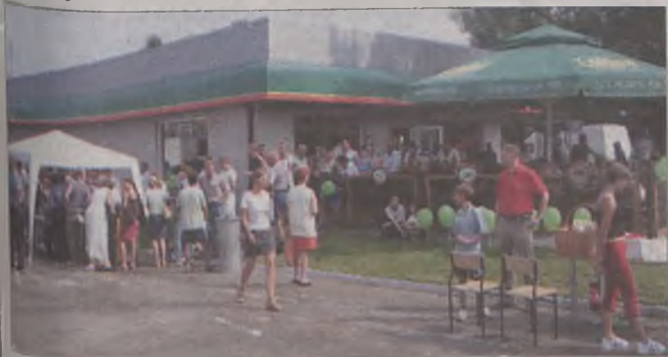
Liczna grupa konkursowiczów pod parasolami czeka na losowanie

Na Stacji Paliw BB w Turku rozstrzygnięto trwający od ponad pół roku konkurs, w którym główną nagrodą był skuter marki Yamaha. Organizatorzy, wbrew najsmielszym oczekiwaniom, otrzymali ponad dziesięć tysięcy kuponów, uprawniających do udziału w losowaniu, które przeprowadzono pod okiem notariusza Macieja Freta.