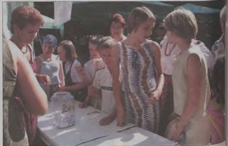
Na loterii wszystkie losy były szczęśliwe

Imprezę pod nazwą „Biesiada na ludowo” zorganizowano w minioną niedzielę w Tuliszkowie. Strawę dla ducha przygotowali artyści ludowi występujący na scenie amfiteatru w parku. O strawę dla ciała z kolei zadbały panie z tuliszkowskiego Forum Równych Szans i Praw Kobiet.