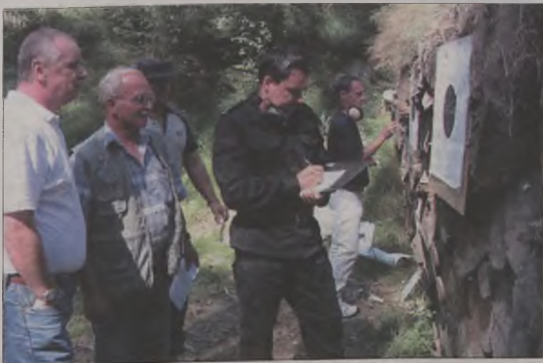
Gdzie się podziały te kule...