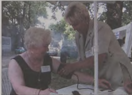
Tuliszkowianie bezpłatnie mogli zbadać ciśnienie tętnicze

Ciekawe propozycje dla uczestników biesiady przygotowały panie skupione w Forum Równych Szans i Praw Kobiet, które było współorganizatorem imprezy. Panie postanowiły „upiec dwie pieczenie przy jednym ogniu”. Mianowicie, uatrak-