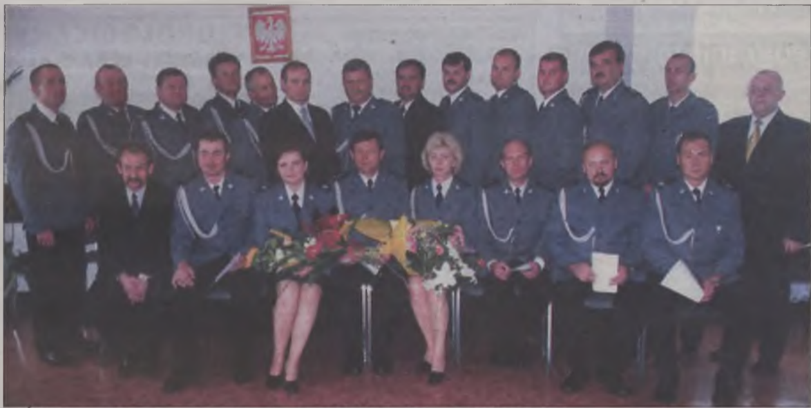
Świętujący funkcjonariusze każdego roku zasiadają do wspólnego zdjęcia