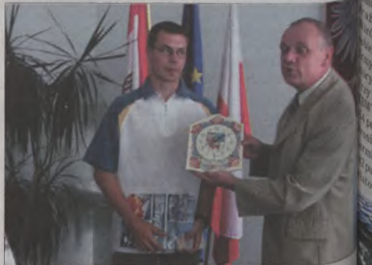
Starosta podarował żeglarzowi m.in. pamiątkowy zegar