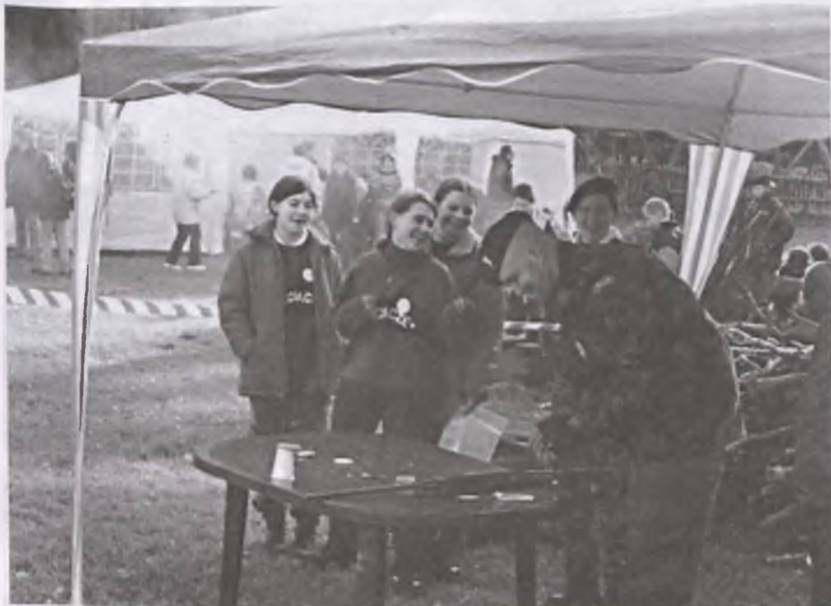
Na mecie rajdu należało wykonać jeszcze dwa zadania, jednym z nich było strzelania z wiatrówki

I. miejsce patrol z 102 SDH „ HURMA ” z Szamotuł