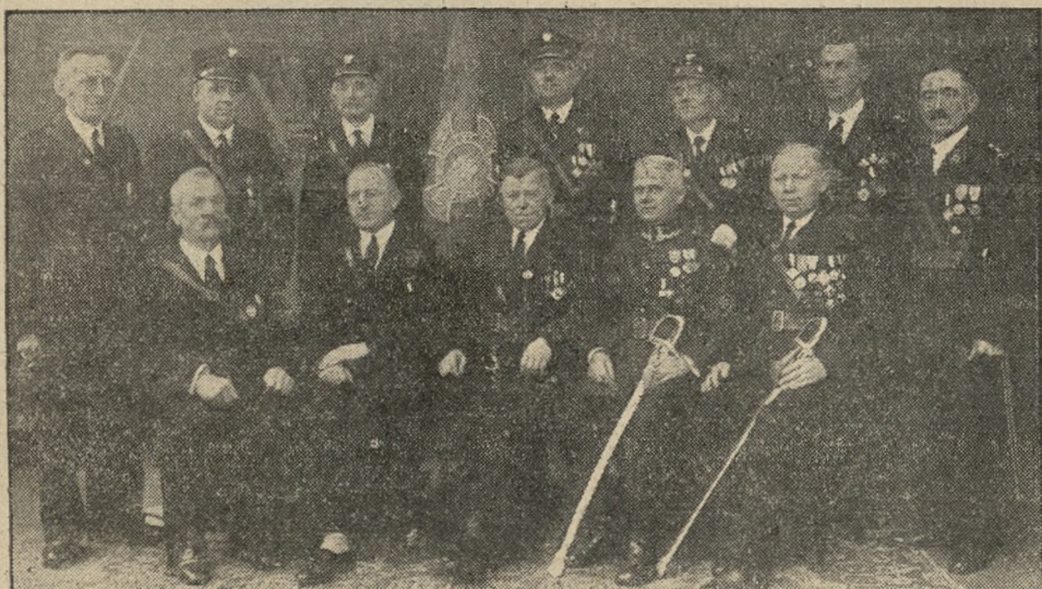
Zarząd i poczet sztandarowy Tow. Uczestników Powstania Wlkp. 1918/19 Poznań-Jeżyce, które to towarzystwo obchodziło w dniu 19 b. m. 10-lecie swego istnienia.

Dawno niewidziana w Poznaniu amerykańska gwiazda filmowa Klara Bow, słynna z wielu awanturek, występuje na ekranie kina „Słońce”.