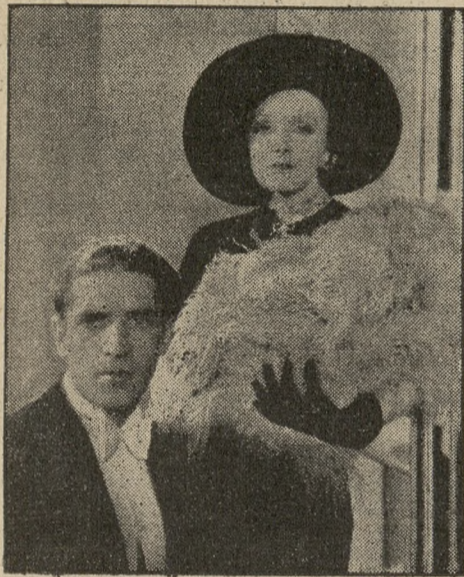
Poznańskie kina „Apollo” i „Metropolis” wyświetlają obecnie najnowszy sensacyjny - erotyczny film polski p. t. „Szpieg w masce”. Główne role kreuje w tym filmie urocza para: znana pieśniarka Hanka Ordonówna i dawniejszy aktor Teatru Polskiego w Poznaniu p. Jerzy Jur Pichelski, których widzimy na zdjęciu.