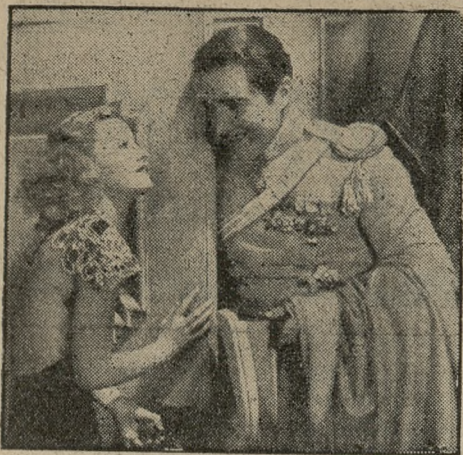
Scena z pięknej operetki filmowej „Jej królewska mość” wyświetlanej na ekranie kinoteatru „Słońce”. W rolach głównych występują rozkoszna Liljanka Harvey i przystojny John Boles.