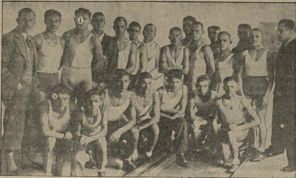
Zespoły pięściarskie „Sokola” i „Drużyna Błękitnych”, które walczyły w niedzielę w spotkaniu towarzyskim, wygranym przez pięściarzy sokolich w stosunku 9:7.