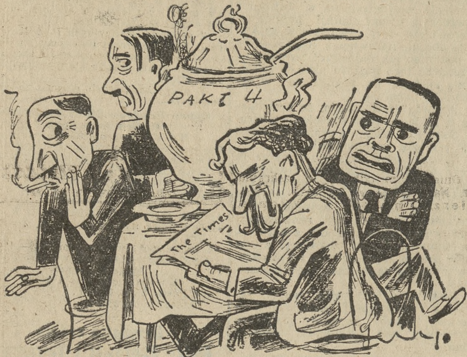
Zupa, którą razem warzyli, lecz której żaden z nich jeść nie chce.