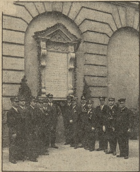
Założyciele Towarzystwa przed Tablicą Pamiątkową

W niedzielę od rana członkowie organizacji oraz bratnie towarzystwa, wśród których zauważyliśmy delegacje Powstańców i Wojaków, „Sokoła”, Podoficerów Rezerwy, Hallerczyków