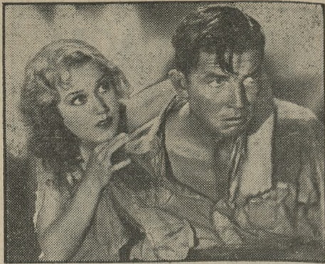
Emocjonująca scena z filmu fantastycznego „King Kong“, wyświetlanego w kinach „Apollo“ i „Metropolis“.

Zwycięzca Napoleona w bitwie pod Waterloo, dowódca wojsk angielskich, generał Wellington, jechał w tej bitwie na koniu Kopenhagen, który również po śmierci otrzymał mauzoleum. Wellington nabył konia tego, który był wnukiem najslawniejszego konia na świecie Eclipse, za 10 000 franków. Koń ten był niezmiernie wytrzymały i potrafił, według własnych oświadczeń Wellingtona, w jednym dniu przebyć 195 km. Rumak ten Wellingtona był o-