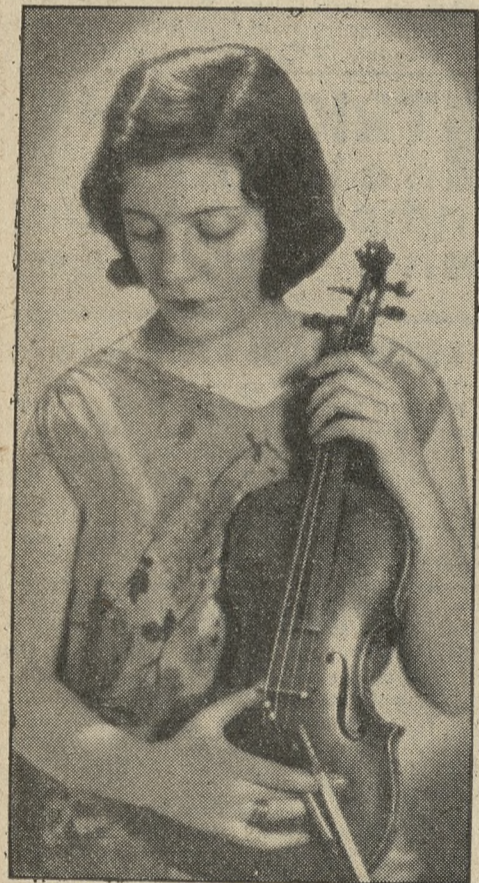
Koncert symfoniczny w Teatrze Wielkim