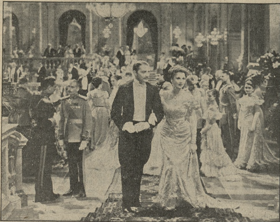
Scena z wspaniałego widowiska filmowego pt. „Kawalkada“, którego premiera odbędzie się dziś, w środę, w kinoteatrze „Słońce“. W rolach głównych występują znakomity artysta filmowy Clive Brook i Diana Wynyard. „Kawalkady“ oczekują miłośnicy kina z ogromnym zainteresowaniem, film ten bowiem odniósł zagranicą niespotykany dotychczas sukces.