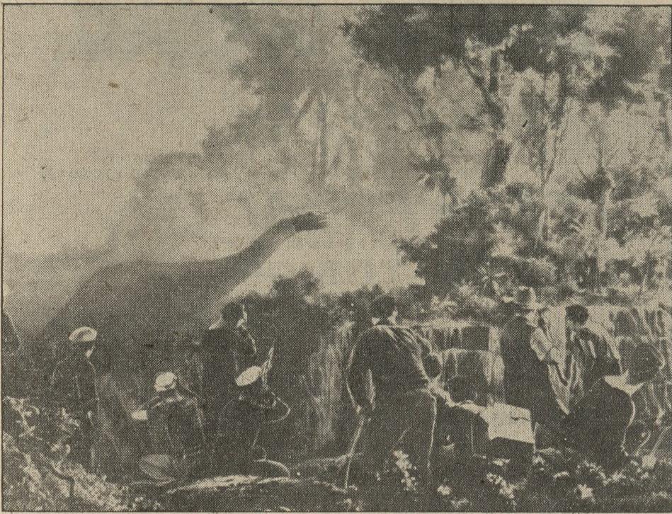
W mieście niebotyków popłoch szerzy niesamowity i upiorny potwór „King Kong”. Sensacyjne wydarzenia i walka z King Kongiem zobrażone zostały w filmie, który ukaże się na ekranach „Apollo” i „Metropolis”.

Od środy, 11 października 1933 r. seanse o godz. 4,30 – 6,30 i 8,30