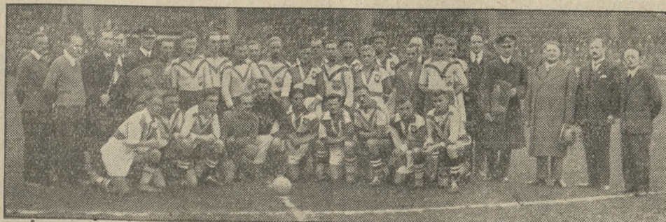
Drużyny marynarki wojennej z Gdyni i reprezentacji Poznania, które rozegrały w niedzielę w Poznaniu spotkanie piłkarskie z wynikiem 5:3 dla Poznania.

K T O POPIERA PRZEMYSŁ ZAGRANICZNY ODBIERA CHLEB ROBOTNIKOM POLSKIM !