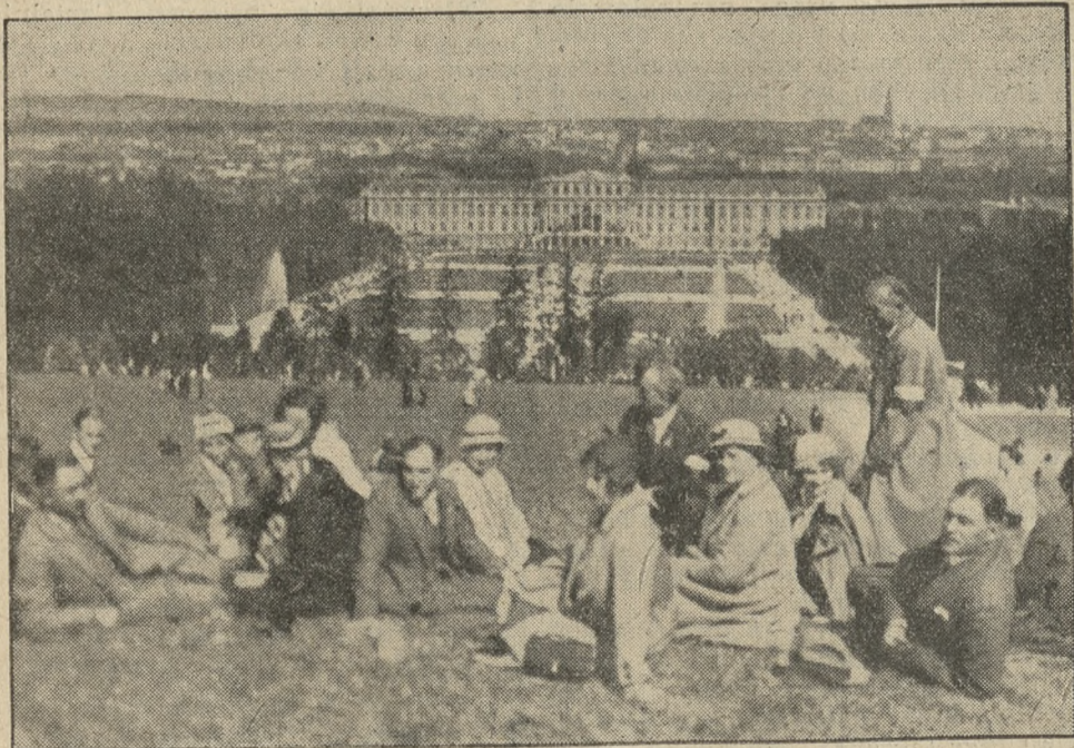
Grupa wycieczkowiczów polskich na stokach parku w Schoenbrunnie. W głębi pałac cesarski, panorama Wiednia oraz, na horyzoncie po lewej, sylwetka Kahlenbergu i Leopoldsbęrgu.