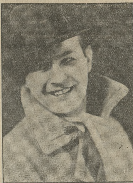
Jan Kiepura w filmie „Zdobycie Cię muszę“.

Nie zdarzyło się dotąd jeszcze, by tancerka o nodze drewnianej zdobyła pierwszą nagrodę w konkursie tańca. Świeżo taki wypadek wydarzył się w Rumunji, w Timiszvára, gdzie pomimo, że liczne pary tancerzy, biorące udział w konkursie posiadały kończyny w zupełnym porządku, pierwszą nagrodę przyznano pewnej studentce z Bukaresztu, której kilka lat temu z powodu wypadku tramwajowego, musiano amputować nogę. Jury konkursu jednomyślnie przyznało, że studentka o sztucznej nodze, wdziękami i elastycznością ruchów przewyższała znacznie innych konkurentów. S. F.