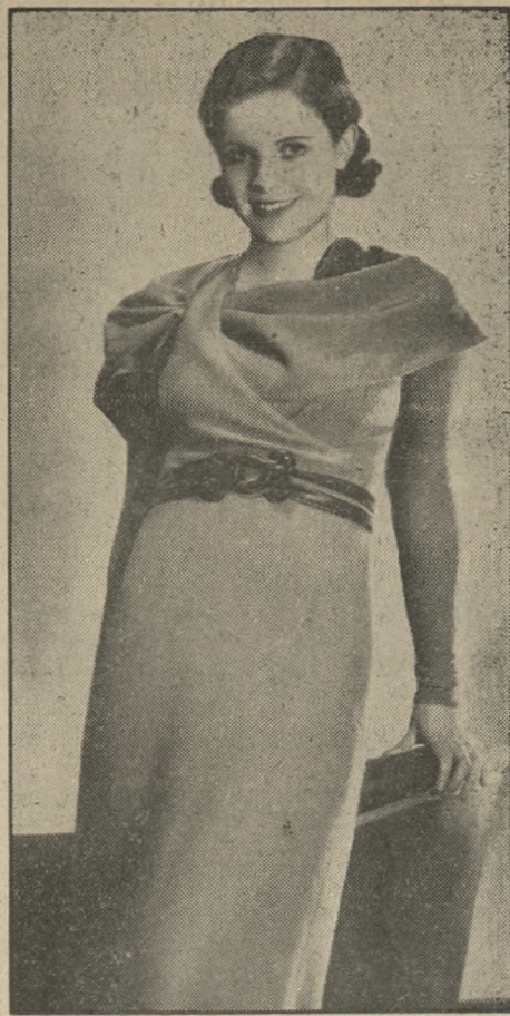
Z najnowszej mody paryskiej: sukienka z matowo-zielonego materiału wełnianego z oryginalnym układem partii górnej. Pasek ciemno-zielony z dużą kłamrą galantową.

I oto teraz na kilka dni ożyły mury starego zamku Fredensborg.