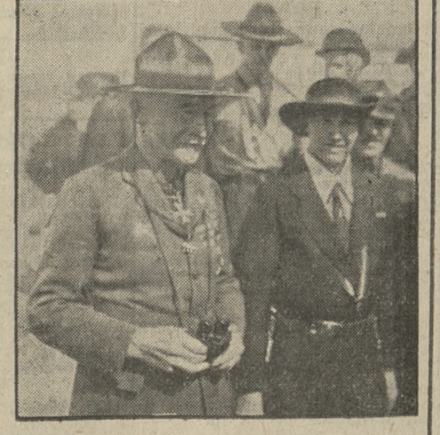
Twórca harcerstwa gen. Baden-Powell wraz z małżonką podczas wczorajszej wizyty w Gdyni.