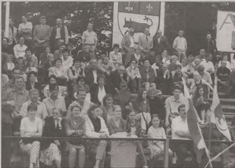
Zmaganiom młodych pożarników przyglądała się liczna publiczność

miejsce z dorobkiem 1.049 punktów zajęła Młodzieżowa Drużyna Pożarnicza z Kawęczyna. Gospodarze tym samym obronili tytuł sprzed roku, a wywalczone w niedzielę mistrzostwo jest już trzecim takim trofeum na ich koncie. Za-