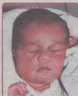
... TYŁCZYŃSKA córka Agnieszki i Macieja ur. 22 czerwca 2002r, godz. 10.00 wazyła 3550g, mierzyła 56cm