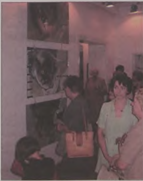
Wystawę odwiedziło sporo turkowian