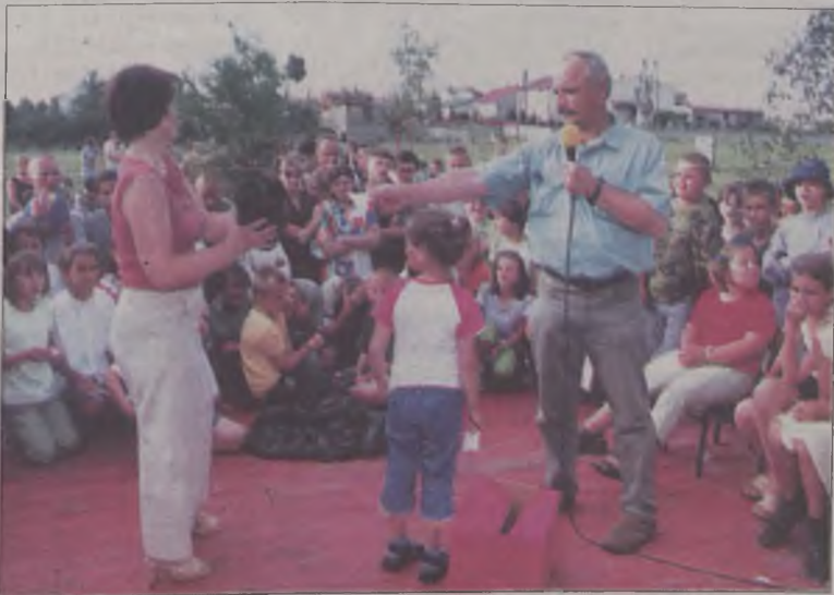
Nagrody często zaskakiwały szczęśliwców

Festyn sportowo-rekreacyjny zorganizowali wspólnie nauczyciele i rodziców dzieci ze Szkoły Podstawowej w Chylinie. Imprezie przyświecało hasło "Przynieśmy radość dzieciom".