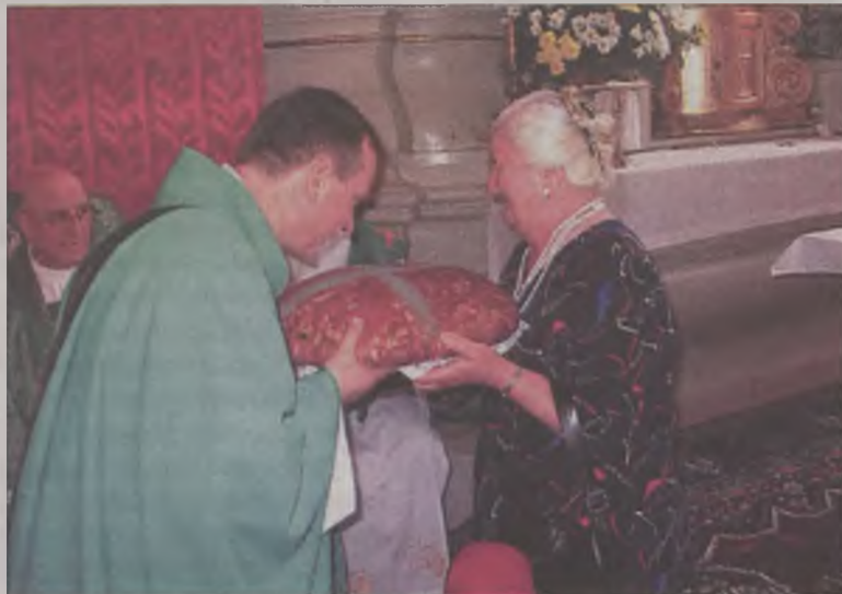
Parafianie powitali proboszcza chlebem i kwiatami

ro po rozmowach z Radą Parafialną. Marzeniem jest piękny, odnowiony kościół. Spacerując ulicami Władysławowa zauważyłem, że jest