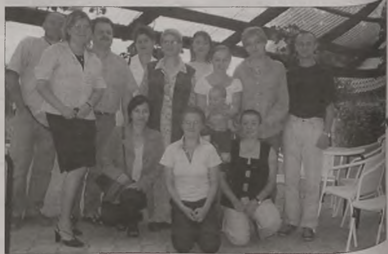
Grupa inicjatywna Towarzystwa Artystycznego „Moderato”

Wniosek o rejestrację Towarzystwa Artystycznego „Moderato” niedługo trafi do poznańskiego sądu. We wrześniu wybrane zostaną władze Stowarzyszenia.