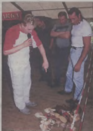
Żeby jedni wygrywali konkurs, inni musieli odać buty

Widownia najbardziej śmiała się z uczestników konkursów karaoke, czyli jakby szansy na sukces na żywo. Wybrani z widowni uczestnicy festynu śpiewali znane piosen-