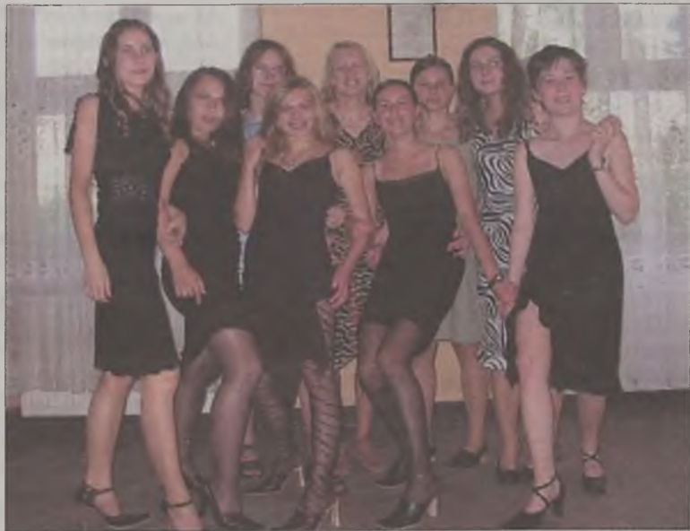
To absolwentki gimnazjum czy liceum?

zarówno uczniowie, jak i nauczyciele i rodzice bardzo dobrze się bawili. O północy absolwentów gimnazjum odebrali rodzice. W I Balu Absolwenta wzięło udział ponad 260 osób, w tym 218 uczniów. AZ