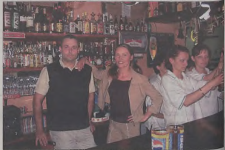
Właściciele Pubu 69 na pierwszych urodzinach swojego „dziecka”

W jednym z konkursów należało uezbić największą liczbę butów uczestniczyli w zabawach mogli raczyć się piwem, którego cena w tym dniu była niższa. Choć konkursy zakończyły się dość szybko zabawa trwała do późnych godzin nocnych. YETI