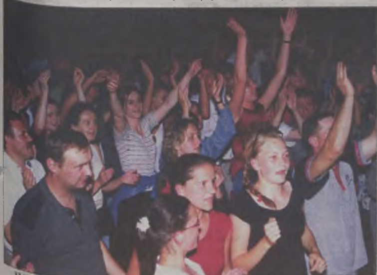
Widownia była spragniona dobrej zabawy

Kilka tysięcy mieszkańców powiatu tureckiego uczestniczyło w dwudniowym festynie zorganizowanym w sobotę i niedzielę, na terenie OSiR-u przez kampanię piwowarską „Warka”.