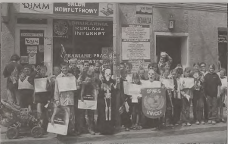
Uczniowie „Piątki” wzbudzali zainteresowanie przechodniów

Dzień bez Tytoniu”. W poniedziałek, 3 czerwca skandując hasła