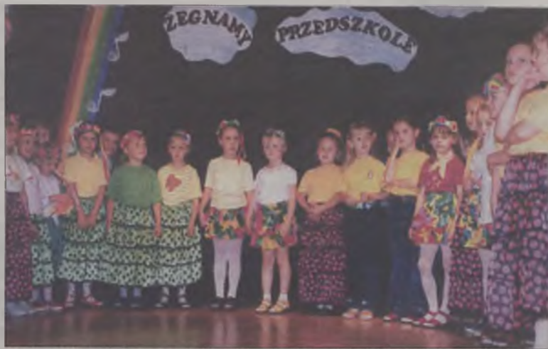
Dzieci na scenie czuły się swobodnie

W przeglądzie każde z przedszkoli pokazało to co ma najwartościowszego, a więc przedszkolaków dla których występ jest ogromnym przeżyciem, a zarazem miłą zabawą. W MDK w Turku wystąpiło ok. 100 dzieciaków. Barwne i muzyczne popisy dzieci zostały przygotowane przez opiekunki i wychowawczynie pracujące w przedszkolach. YETI