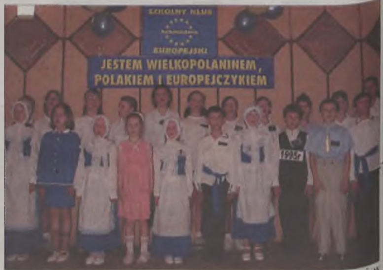
„Oda do radości” w wykonaniu dzieci ze Szkoły Podstawowej w Koźminie

ski zapoczątkuje nową, wspaniałą tradycję szkoły, polegającą na corocznych spotkaniach lokalnej społeczności i dobrej zabawie. Jednocześnie dyrekcja i nauczyciele szkoły podkreślają, że festyn odbył się dzięki pomocy i zaangażowaniu miejscowej jednostki OSP, rodziców i pań z Koła Gospodyń Wiejskich, którym należą się największe podziękowania. AZ