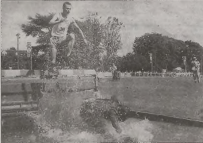
Upadek Kenijczyka uniemożliwił walkę o złoto

„Byłem - mówi - bardzo dobrze przygotowany do tego występu. Po pokonaniu połowy dystansu czułem, że z powodzeniem mogę walczyć o złoto. Wówczas zaczął się pech. Biegłem na drugiej, dogodnej do ataku pozycji. Pokonując jedną z przeszkód na trzecim kole, zostałem z tyłu popchnięty. Upadłem. Pomimo obtarć natychmiast się podniosłem i kontynuowałem bieg. Spadłem na szóste miejsce, ale szybko odrobiłem utracony do prowadzącego dystans. Pech mnie jednak nie opuszczał. Na końcowym rowie z wodą upadł przede mną Kenijczyk. Chcąc go ominąć zmuszony byłem odskoczyć i podeprzeć się, co kosztowało mnie stratę kolejnych cennych sekund. Ostatecznie zajęłem drugie miejsce, tuż za