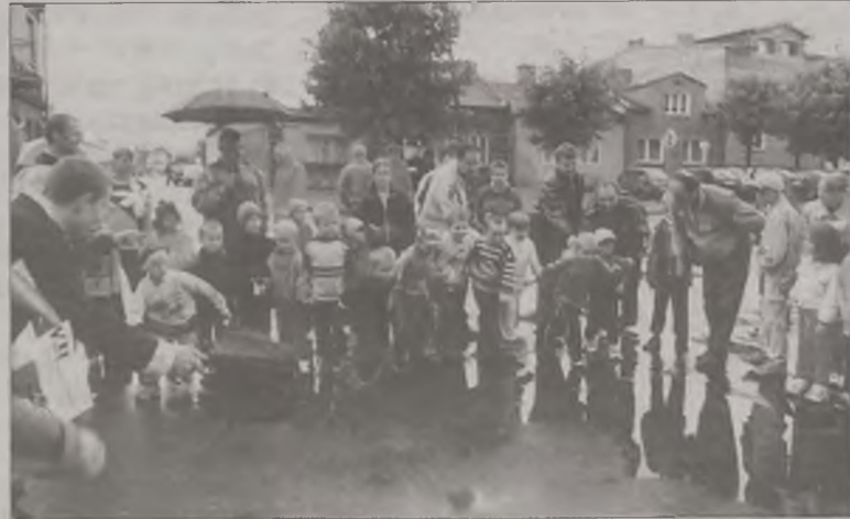
Biegano przy padającym deszczu

Wszyscy uczestnicy biegów, którzy zajęli miejsca I - III otrzymali dyplomy i nagrody rzeczowe, a wszystkie przedszkolaki dodatkowo nagrody pocieszenia i dyplomy za udział. Dla wszystkich biegaczy organizatorzy przygotowali smaczną grochówkę. AZ