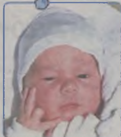
... MYSŁOWSKI syn Agnieszki i Cezarego ur. 28 maja 2002r, godz. 3.40 wżył 4530g, mierzył 58cm