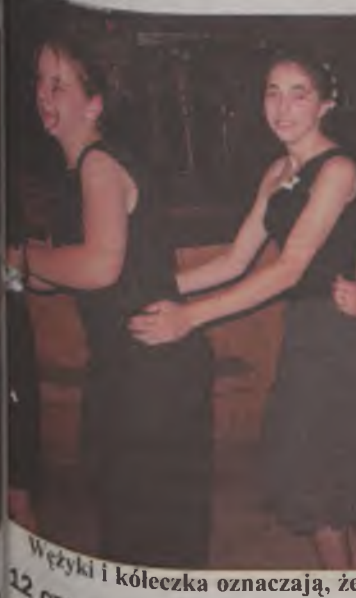
Wężyki i kółeczka oznaczają, że zabawa była wyśmienita

Później rozpoczęła się dyskoteka, którą prowadził discjockey z Gminnego Ośrodka Kultury we Władysławowie. Zabawa planowana była do godz. 23.00. w międzyczasie, po godz. 21.00 dla zgłodniałych na grillu upieczono kiełbaski. Podczas zabawy na parkiecie można było zauważyć głównie dziewczęta, w większości w ogóle nie przypominających nastolatek. Dorosłe fryzury, wyzywające makijaże, długie suknie balowe i „wirujący seks” spowodowały, że gimnazjalistki, w przeciwieństwie do swych kolegów, wyglądały jak młode, około dwudziestoletnie kobiety. Niektóre z nich przyznały, że założyły czerwoną bieliznę. Jak twierdziły, podobnie jak przyszłym maturzystom na studniówce, tak i im miała ona przynieść pomyślny wynik testu gimnazjalnego.