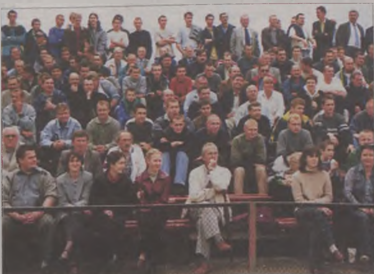
Kibice MKS Tur Turek bardzo długo czekali na ten moment