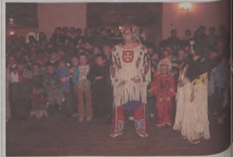
Indiańskie stroje wzbudzały zachwyt dzieciaków

Organizatorem zabawy był Urząd Gminy Turek, a współorganizatorem i gospodarzem Szkolnego Podstawowa w Żukach. Jak poinformowano, festyn odbył się właśnie z inicjatywy tej szkoły.