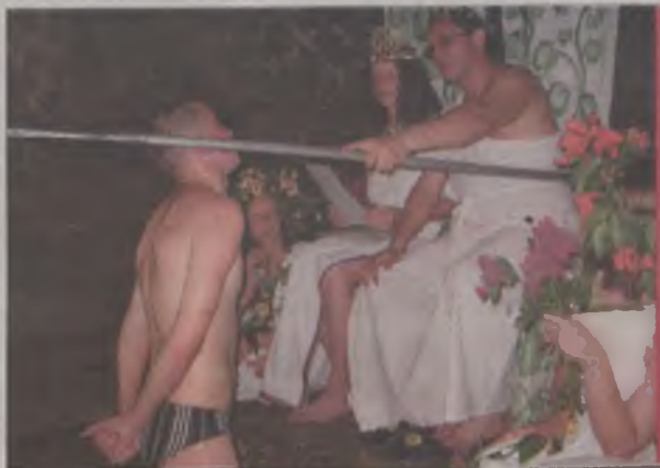
Przed obliczem Neptuna

holowania osób, a nawet czytania gazety podczas płynięcia były nierzadkim spotkaniem ze złośliwymi diabłami czy wizytą w jadalni pięknych nimf Neptuna, które podawały tajemniczą miksturę o nieprzeciętnie o h y d n y m smaku. Kan-