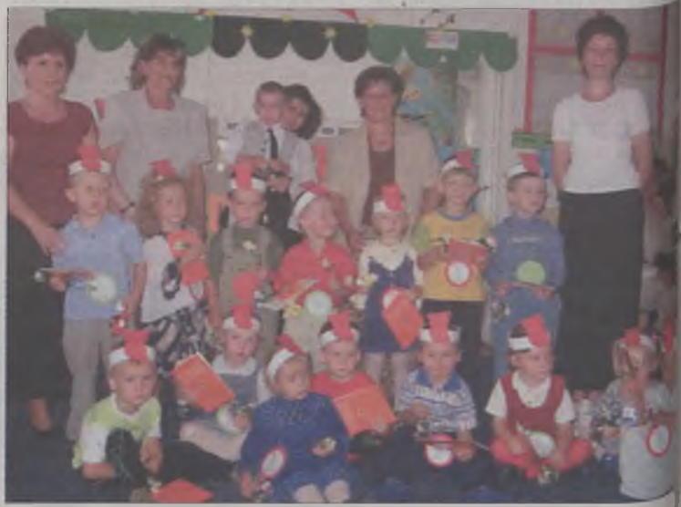
Trzylatki wreszcie stały się prawdziwymi przedszkolakami

Zanim jednak stały się pełnoprawnymi przedszkolakami, w programie artystycznym udowodniły, że potrafią tańczyć i śpiewać piosenki. Dzieciaki zostały nagrodzone brawami przez widownię, na której zasiadły many przybyłe na uroczyste obchody Dnia Matki. Po „maluszkach” prezentowały się starsze dzieci, a każde dla swej mamy przygotowało upominek.