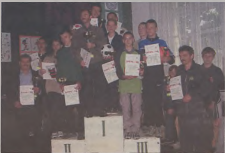
Na podium zwycięskie drużyny

III Mistrzostwa Wielkopolski Domów Dziecka w strzelaniu sportowym odbyły się w minioną sobotę, 8 czerwca w Domu Dziecka w Turku. Wzięło w nim udział ponad 30 strzelców reprezentujących sześć wielkopolskich domów dziecka.