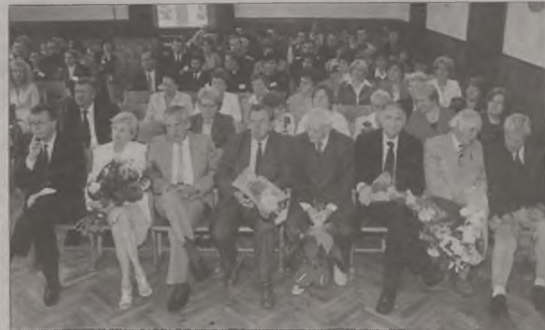
Absolwenci turkowskiego liceum i ich profesorowie. Tym razem świętował „Matura rocznik 1982”

Podczas zjazdu na scenie dla przybyłych absolwentów zapre-