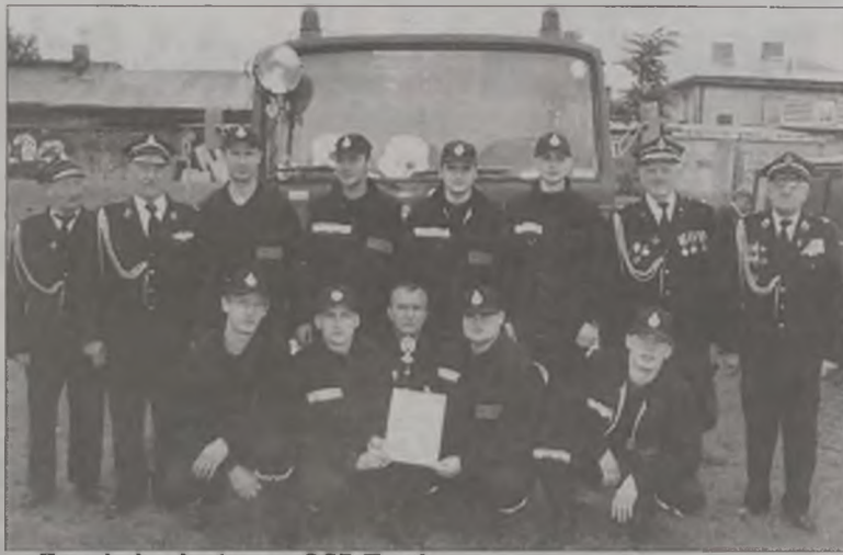
Zwycięska drużyna z OSP Turek

Nagrodami dla uczestników był sprzęt AGD i RTV. Nie obyło się również bez zwyczajowej grochówki z wkładką. (can)