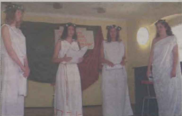
Greckie muzy przygotowały dla absolwentów kilka życiowych rad

Czwarta matura w historii Prywatnego Liceum Ogólnokształcącego wypadła bardzo pomyślnie. Ogólna średnia egzaminu dojrzałości w szkole wyniosła trochę ponad cztery. W części pisemnej jeden uczeń z matematyki otrzymał ocenę celującą. Poza tym było pięć ocen bardzo dobrych (matematyka – 2, język polski – 1, historia – 2). Jeszcze lepiej wypadła część ustna, w której uczniowie łącznie otrzymali jedną ocenę celującą z języka angielskiego i czternaście ocen bardzo dobrych (matematyka – 3, język polski – 4, historia – 2, biologia – 1, język angielski – 4). AZ