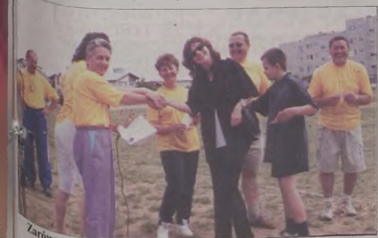
Zarówno uczestnikom jak i organizatorom dopisywał humor