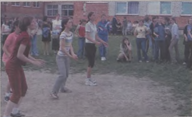
Gra w siatkówkę to niezła zabawa

każdy za udział w zabawie otrzymał nagrodę (kalkulator) ufundowaną przez sponsorów. Obchody Dnia Dziecka stały się okazją do nagro-