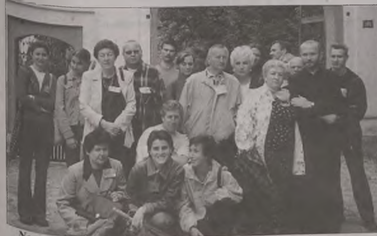
Na wycieczce Łądzie

W spotkaniu brało udział wielu gości, m.in. rektor PWSZ prof. dr hab. Józef Orczyk oraz przedstawiciele Instytutu Pracy Socjalnej. Całodniowa impreza jeszcze bardziej zintegrowała środowisko ŚDS. Nie byłoby to możliwe, gdyby nie sponsorzy: klub „Hutnik”, hurtownia napojów przy ul. Europejskiej w Koninie, piekarnia GS w Golinie i Zakład Fotograficzny „Foto – Sypniewski” w Koninie, którym studenci składają serdeczne podziękowania. AZ