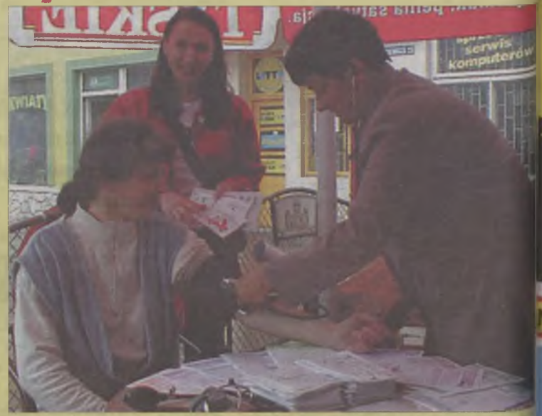
PCMS „ŻAK” dziękuje właścicielom hotelu „Arkady” za udostępnienie ogródka oraz Sekcji Oświaty TSSE za przekazane ulotki.