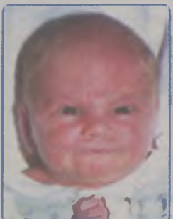
... ZIĘBA córka Bożeny i Zdzisława ur. 26 maja 2002r, godz. 3.00 wazyła 3100g, mierzyła 50cm