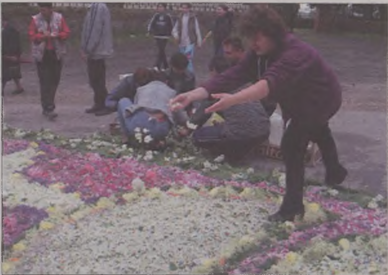
Zanim powstanie dywan, kwiaty trzeba posegregować

Mieszkańcy kwiaty zbierają we własnych ogrodach i na łąkach. Wczesnie rano przychodzą na ulicę, kredą szkicują wzór dywanu, po czym wypełniają go różnokolorowymi kwiatami i listkami. Kiedy o godz. 11.30 rozpoczyna się msza, praca nad dywanem jest zakończona, a ulica przypomina kolorową wstążkę. AZ