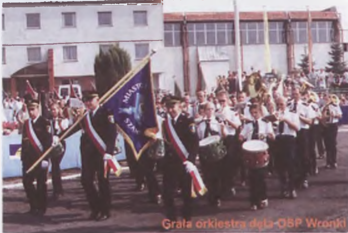
Grała orkiestra dęta OSP Wronki