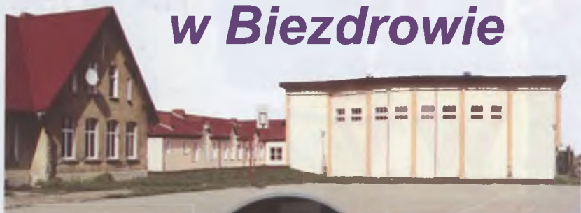
Placówka trzech wieków

Za salą sportową powstaje kompleks boisk sportowych.