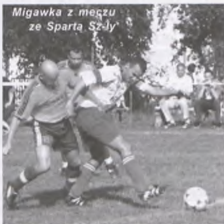
Migawka z meczu ze Sparta Sz-ly