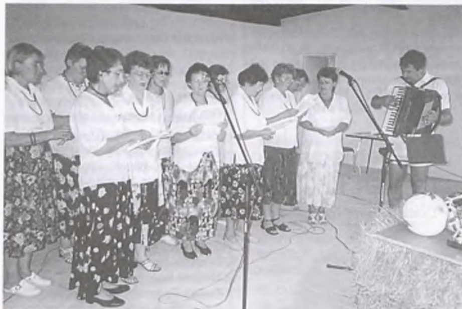
Koło Śpiewacze Domu Kultury w Chojnie