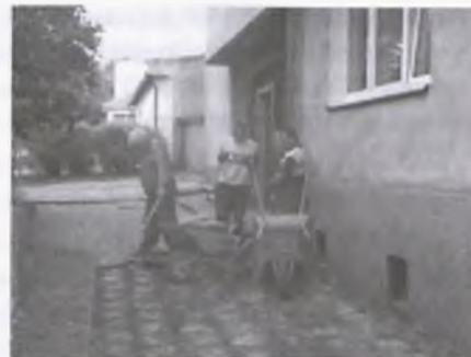
fol. 4 X I.Vowiw