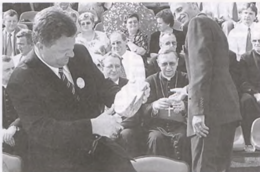
Starosta szamotulski, Paweł Kowzan kroi dożynkowy bochen chleba, częstuje chlebem ks. arcybiskupa Stanisława Gądeckiego starosta dożynkowy Józef Kwaśniewicz.

Tydzień później odbyły się dożynki w miejscowości Oborniki.