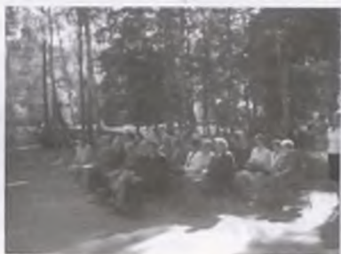
fol. I. Vowio

W dniu inauguracji odwiedziliśmy Zespół Szkół nr 1 na Zamościu. W uroczystym rozpoczęciu roku szkolnego uczestniczyli zaproszeni goście, przedstawiciele Rady Powiatu, Rady Gminy, rodzice, nauczyciele (45). W Zespole Szkół drugi rok funkcjonuje również gimnazjum. W pierwszym roku otworzono dwie, w tym