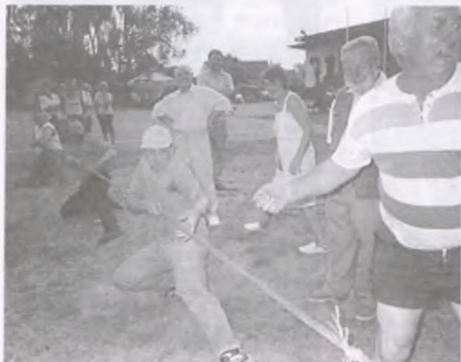
Ciągnie drużyna Chojno Błota