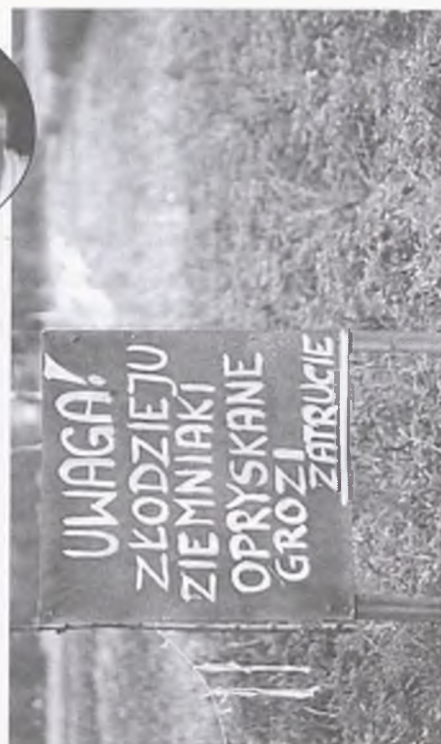
Tę tablicę spotkałimy w Chojnie - Błota