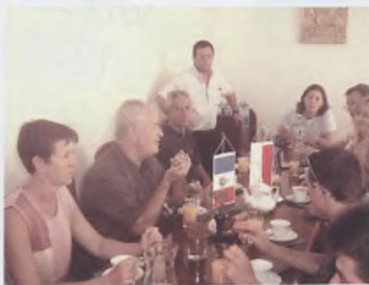
Goście z Francji w gabinecie Burmistrza