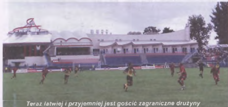
Teraz łatwiej i przyjemniej jest gościć zagraniczne drużyny