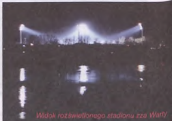
Widok rozświetlonego stadionu zza Warty