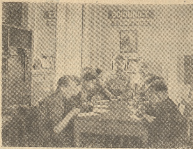
Ostatnio odbyła się w Poznaniu wojewódzka konferencja kierowników państwowych domów dziecka, zakładów wychowawczych oraz kierowników referatów opieki nad dziećmi przy wydziałach prezydentów miejskich i powiatowych rad narodowych, poświęcona analizie wyników nauczania za I półrocze. W skali wojewódzkiej najlepszymi wynikami nauczania mogą poszczycić się Państwowe Domy Dziecka: — Bodzewo, pow. Śrem i Lubstów, pow. Koło. Na dalszych miejscach znalazły się: Wolsztyn i Mielno. Szeroko dyskutowano również na temat form i metod pogłębiania oraz poszerzania wiedzy, zdobytej w szkołach poprzez kółka zainteresowań, praktyk technicznych, przyrodniczych, gospodarczych i społecznych. (jki)

Począwszy od dnia 15 bm. wiadomości z województwa zielonogórskiego zamieszczać będziemy w wydaniu AB „Głosu Wielkopolskiego”.