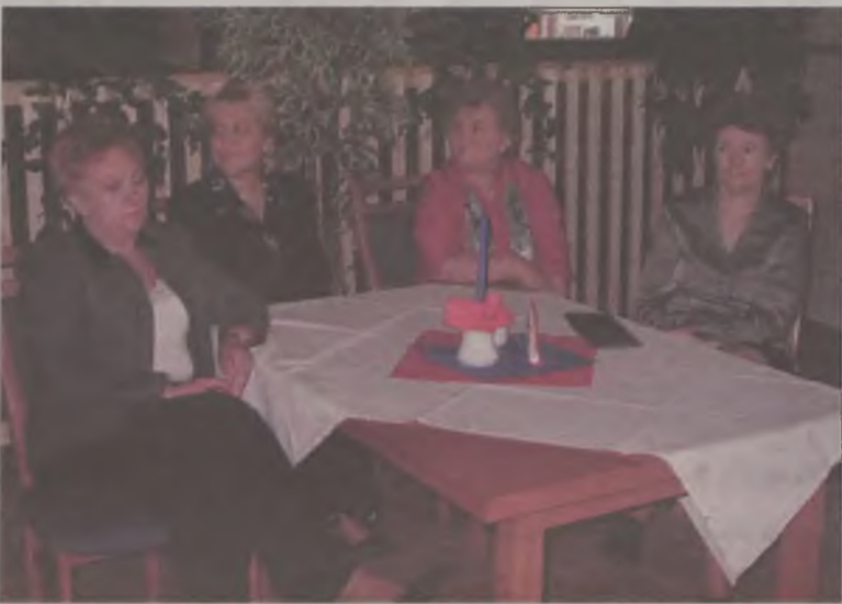
Podczas otwarcia obsługa lokalu mogła zająć stoliki dla gości

Sala kawiarniana będzie czynna od wtorku do piątku w godz. 15.00-22.00, a w soboty i niedziele w godz. 16.00-23.00. AZ