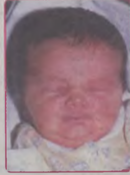
... SYNENKO córka Beaty i Sławomira ur. 14 marca 2002r, godz. 18.45 wazyła 3200g, mierzyła 53cm