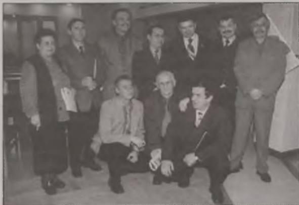
Marian Krzaklewski w otoczeniu działaczy „Solidarności”

PAK-u i kopalni „Konin” lider „Solidarności” radził wszystkim związkowcom z Adamowa zdecydowanie