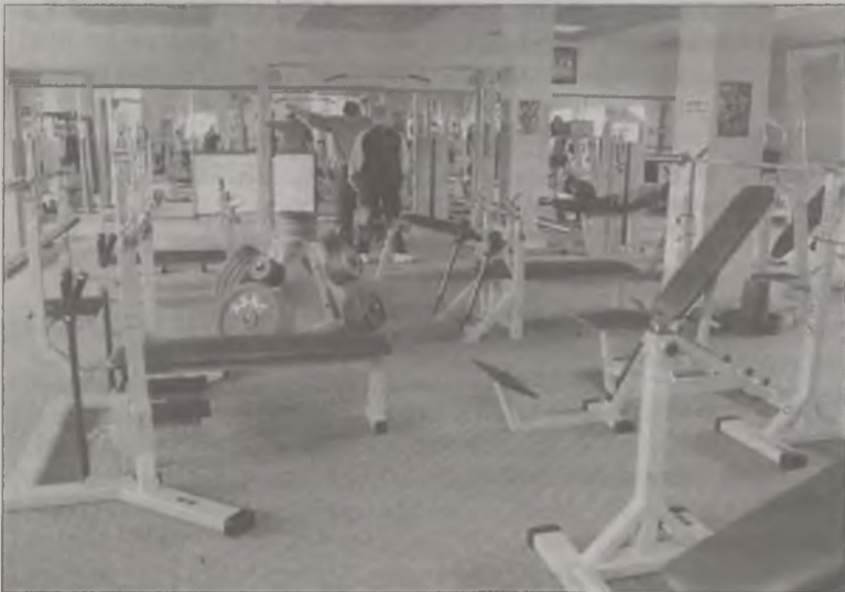
W „Maximucie” ważny jest przebogaty sprzęt, ale ...

Sam obiekt robi na widzu imponujące wręcz wrażenie. Już sama siłownia wzbudzać musi podziw. Oto bowiem na powierzchni ponad 300 metrów kwadratowych oczekuje na klientów przegromna ilość sprzętu treningowego, nieraz wręcz o zagadkowym przeznaczeniu. Na spragnionych czeka bufet z napojami chłodzącymi i regenerującymi. Nie trzeba dodawać, że bez alkoholu.