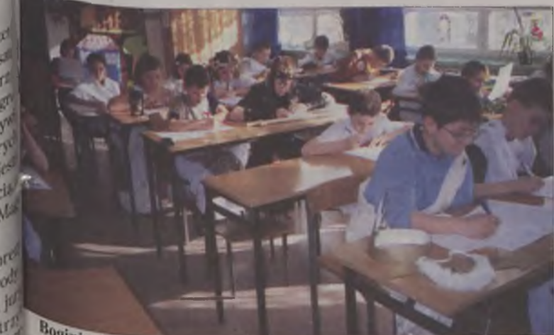
Boginie, bogowie i herosi w ławkach