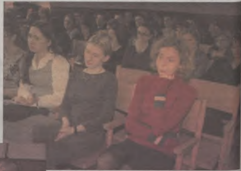
Młodzież z zainteresowaniem słuchała wykładów profesorów z UAM

Tegoroczna sesja nosiła tytuł “Autobiografizm w literaturze współczesnej”, odbyła się 14 i 15 marca, a wzięli w niej udział wykładowcy z Uniwersytetu im. A. Mickiewicza w Poznaniu. Profe-