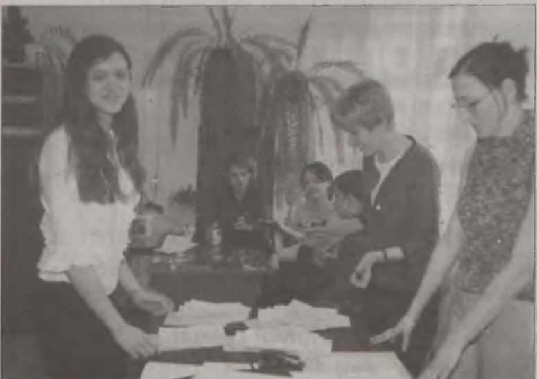
Młodzież z Technikum Technologii Żywności z pewnością wie, jak walczyć ze stresem

Kolejne spotkanie promujące zdrowy styl życia w Zespole Szkół Zawodowych w Turku odbyło się we wtorek, 19 marca i zostało poświęcone wpływowi czynników psychologicznych i żywienia na powstawanie i rozwój chorób układu krążenia, a odbywało się pod hasłem „Serce masz tylko jedno”. AZ