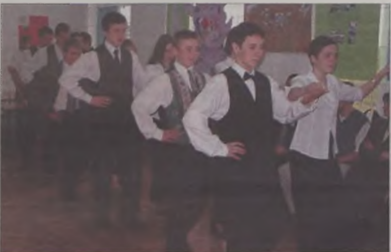
Gimnazjaliści w rytmie poloneza