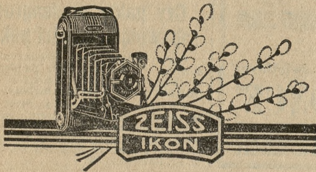
Największy w Polsce Magazyn Aparatów i Przyborów Fotograficznych. Założony w r. 1910.

Ukazała się w nakładzie „GŁOSU“ pełna dynamiki