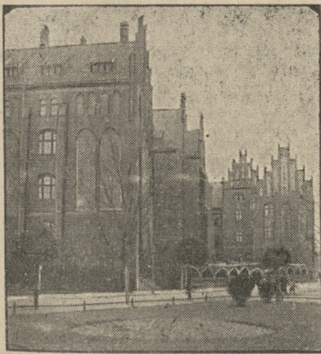
Siedzibą przyszedł Akademii Toruńskiej ma się stać gmach, w którym dotąd mieści się Pomorski Urząd Wojewódzki. Gmach ten zbudowali Niemcy do użytku szkolnego