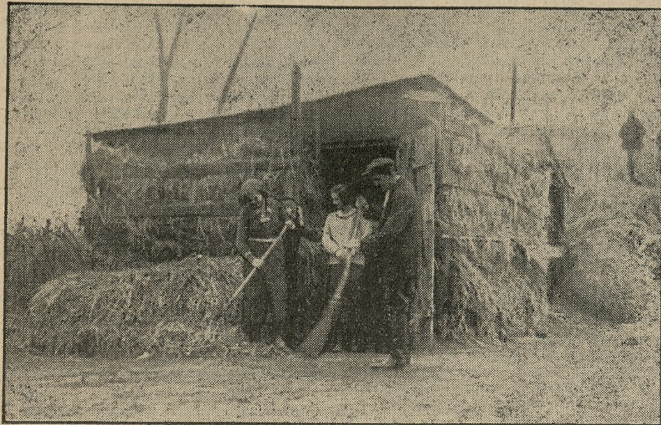
Są w osiedlu nędzne schroniska z desek, wymoszczone słomą, liściem i t. p. podtrzymywanych prętami leszczyny.

Smutny obraz nad głównym traktem — 600 bezdomnych i bezrobotnych — Nędza materialna i moralna — Wysiłek ks. prał. Mazurkiewicza i Tow. św. Wincentego a Paulo — Ratunku — potrzeba wszystkiego!