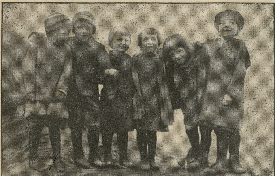
Gromada dzieci z osiedla przy ulicy Warszawskiej z radością pozuje fotografowi „Kurjera Poznańskiego”. Jak po buciakach widać, potrzeba tam oprócz odzieży i żywności, także obuwia.

Uzyskane od wojska baraki z blachy cynkowej dają wprowadzić schronienie, jednak latem panuje tu nieznośny upał, a zimą syberyjski mróz. Fakt, że mieszka tam około 600 osób,