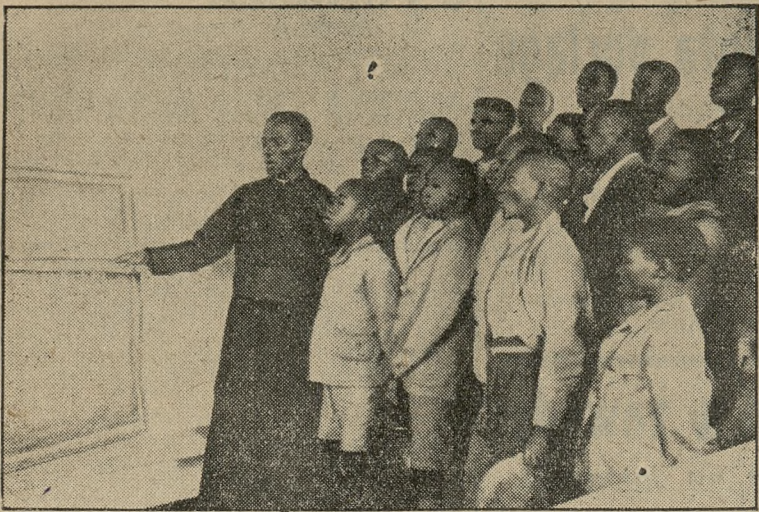
Lekcja śpiewu w Afryce (do korespondencji „Z pod żarów podzwrotnikowych“ w numerze 50).