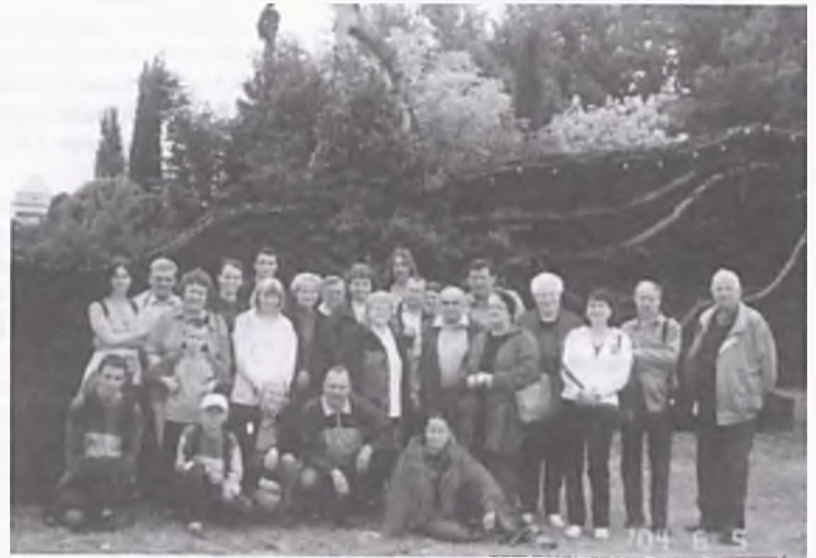
W Nowym Tomysłu przed rekordowym koszem z wikliny.

Następnie odwiedziliśmy Wielkopolskie Muzeum Pożarnictwa w Rakoniewicach, które mieści się w budynku dawnego zboru ewangelickiego o konstrukcji szachulcowej z 1763 r. oraz w nowych pawilonach wystawienniczych. Zgromadzono tutaj ponad 4 tysiące eksponatów,