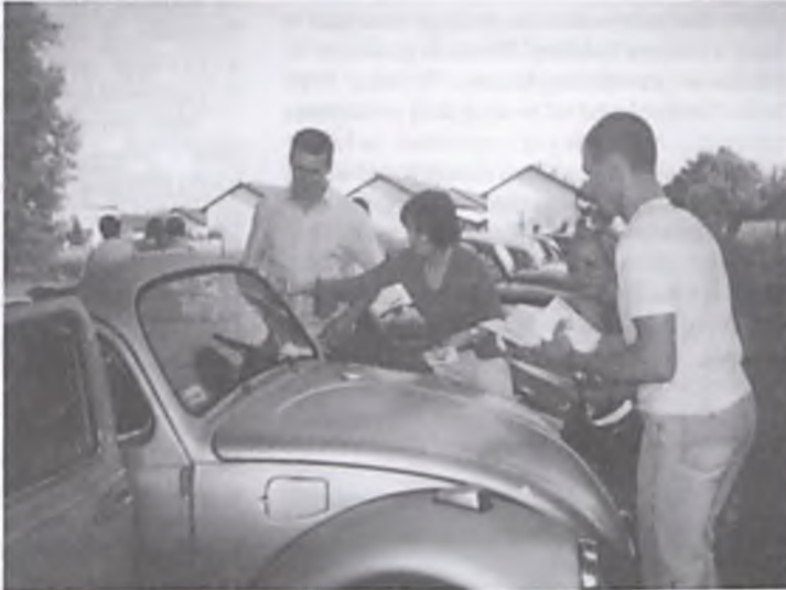
Rajd Garbusów.

trasie obiektów. Na mecie czekały na nich: kawa, herbata, drożdżówki, grochówka z kotła. Przy ustalaniu wyników najmniejsze znaczenie miał czas przejazdu, by dać szansę zamiejscowym. W ostatecznej klasyfikacji I, II i III miejsca, nagrodzone pucharami zajęli odpowiednio: panowie