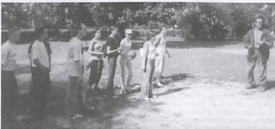
Na trasie rajdu.

Wszystkim uczestnikom gratulujemy wytrwałości! Do zobaczenia za rok!