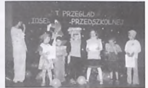
I Przegląd Piosenki Przedszkolnej.