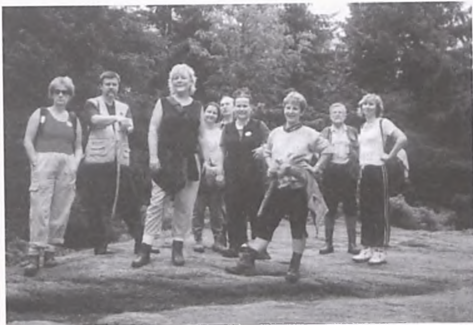
Malinowska Skala

miejscowości wyruszyliśmy także na szlaki górskie. Udało się nam zrealizować następujące trasy wycieczek górskich, które dostarczyły uczestnikom niezapomnianych wrażeń. Trasa pierwszej obejmowała przejście od przedmieścia Bielska-Białej do schroniska na Dębowcu (520 m), dalej do dolnej stacji kolejki Szyndzielnia i wjazd kolejką gondolową na Szyndzielnię Górną, dojście do schroniska PTTK Szyndzielnia (1001 m), następnie do schroniska na Klimczoku (1119 m) i zakończenie trasy zejściem do Szczyrku. Trasa drugiej, bardzo trudna, a zarazem najpiękniejsza, przebiegała wzdłuż brzegu Czarnej Wiselki w stronę schroniska na Przysłopie, dalej przez Baranią Górę (1220 m) do źródeł Wisły, na Górkę Wiślaną, Malinowskie Skąły, do schroniska na Skrzycznem (1257 m) i stacji kolejki, zakończona zjazdem do Szczyrku. Niejedną kroplę potu trzeba wylać, aby pokonać tę trasę. Warto nieco się potrudzić, bo to co zobaczymy po drodze przechodzi najsmielsze wyobrażenia. Trasa wiedzie wśród wspaniałych krajobrazów. Robią wrażenie rozległe przestrzenie, przepiękna panorama gór oraz zabagniony moczarowaty las, ze źródłowymi potokami Wisły. Trzecia trasa obejmowała wjazd kolejką linową z Ustronia na Czantorię, dojście do schroniska Soszów (886 m) i zejście w miejscowości Wiśla. Program wycieczki został w pełni zrealizowany, a jej uczestnicy byli zadowoleni i dumni z pokonania trudnych tras górskich.