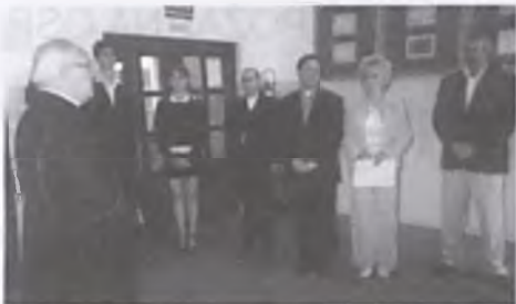
Goście w holu szkoły.