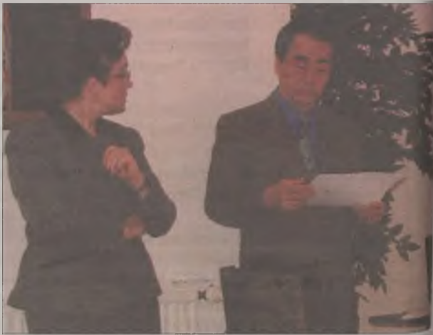
Podczas spotkania z Turecką Izbą Gospodarczą