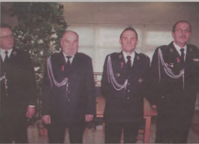
Odnaczeni za wysługę lat