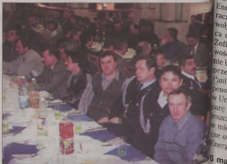
W zebraniu wzięło udział niemal dwustu strażaków

sumowali miniony rok, w którym na szczęście rzadko mieli uczestniczyć w akcjach gaśniczych. Druhowie zapoznali się z planami działania i planem finansowym jednostki na rok 2002.