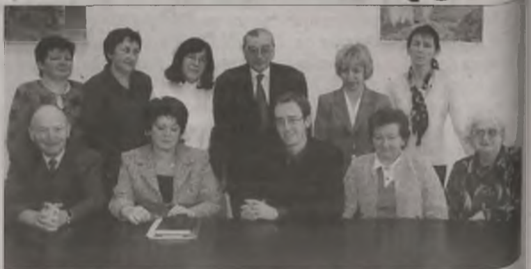
Księgowi uczestniczący w szkoleniu

Turkowski Oddział Terenowy Stowarzyszenia Księgowych w Polsce przy współpracy z Oddziałem Wielkopolskim zainaugurował tegoroczną działalność szkoleniową. W ubiegły czwartek, 28 lutego odbyło się pierwsze spotkanie rozpoczynające cykl odczytów o tematyce zasad rachunkowości w świetle międzynarodowych standardów rachunkowości.