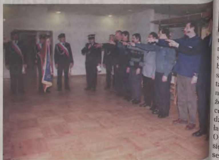
Ślubowanie nowych druhów kopalnianej OSP

Spotkanie strażaków stało się okazją również do uhonorowania