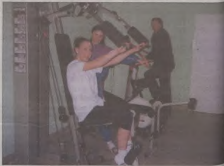
Zajęcia na nowym sprzęcie

rym zalecono ćwiczenia korekcyjne związane z wadą postawy.