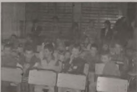
Uczestnikami zajęć w świetlicy środowiskowej będą wychowankowie Domu Dziecka, jak również dzieci z „miasta”

kę i zajęcia dla 15 osób z rodzin uboższych. Uczestnikami zajęć będą dzieci w wieku szkolnym i ich rówieśnicy, wychowankowie Domu Dziecka. Podczas zajęć, które od-