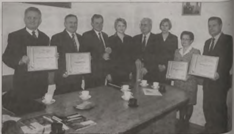
Nominowani do tytułu HIT 2001 z ziemi turkowskiej

Podczas uroczystości otwarcia świetlicy nie zabrakło ilościowego występu. Na scenie zaprezentował się zespół muzyczny z Konińna. YETI