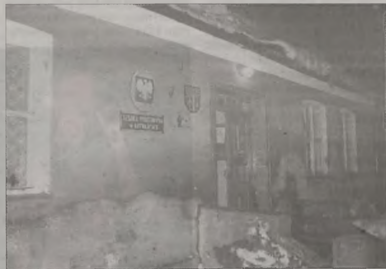
Szkoła Podstawowa w Kotwasicach jest najstarszą w gminie Malanów