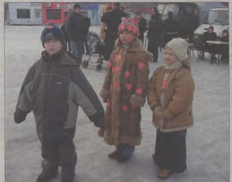
Dzieciaki wrzucały do skarbonki monety i rywalizowały w liczbie posiadanych serduszek