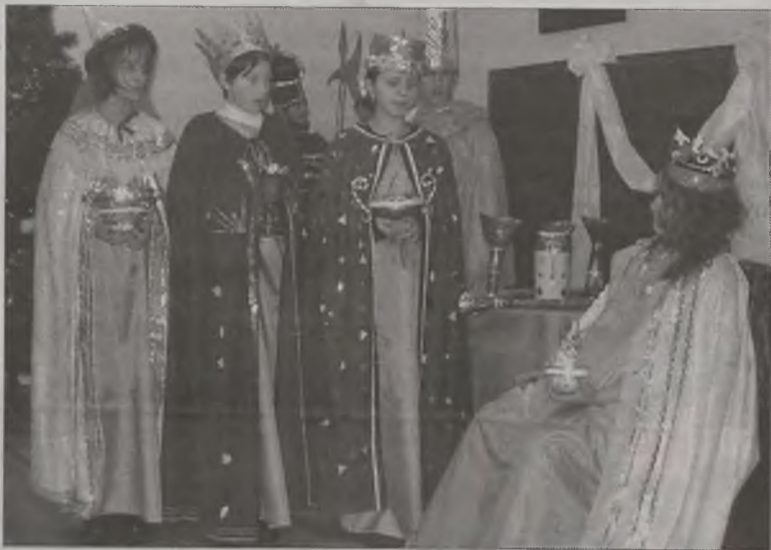
„Herody” w wykonaniu zespołu „Tertius”

Wójt poinformował, że na terenie gminy Władysławów 240 podmiotów prowadzi działalność gospodarczą w różnej branży, od sklepów zaczynając a na zakładach stolarskich, transportowych kończąc. Najwięcej mieszkańców gminy zatrudniają oczywiście Kopalnia Węgla Brunatnego „Władysławów”. Za nią są: Gminna Spółdzielnia „Samopomoc Chłopska”, zakłady „Near” i „Koł-