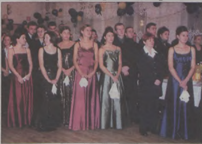
Ten bal na długo pozostanie w pamięci maturzystów