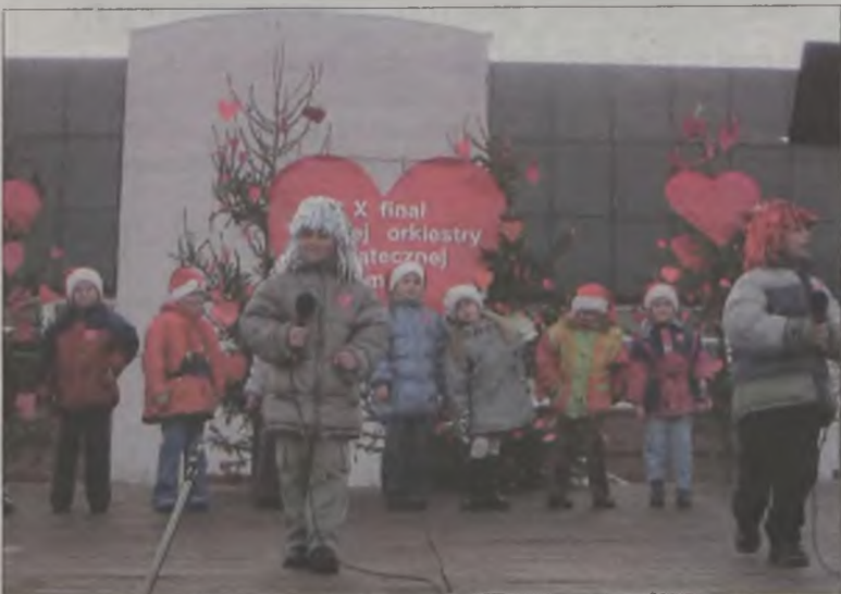
Przedszkolaki wystąpiły z repertuarem zespołu „Ich Troje”

Kopalnia Węgla Brunatnego „Adamów” w Turku podarowała Orkiestrze prawie metrowy, ważący 11 kilogramów, kiel mamuta. Kiel był najcenniejszym eksponatem kopalnianego muzeum. Podczas aukcji w Koninie osiągnął kwotę pięciu tysięcy złotych, ale dalsza licytacja odbywała się w Internecie. Kolekcjoner z Katowic podczas internetowej aukcji kupił kiel za 10.100 złotych. Do tej sumy 5.000 złotych dołożył Zespół Elektrowni „PAK”.