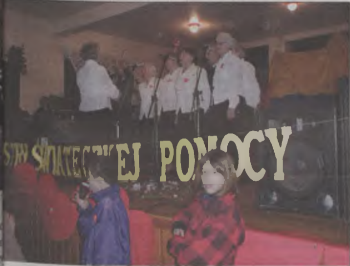
Wszyscy, zarówno seniorzy, jak i najmłodszy mieszkańcy gminy świętę bawili

Współorganizatorzy X Finału Wielkiej Orkiestry Świątecznej Pomocy w Tuliszkowie byli: Urząd Miasta i Gminy, Miejsko-Gminny Ośrodek Kultury, Ochotnicza Straż Pożarna w Tuliszkowie, Komisariat Policji, Parafia Rzymsko-Katolicka i rodzice uczniów Zespołu Szkół w Tuliszkowie. AZ