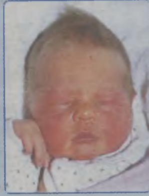
... WOJTASIK syn Justyny i Piotra ur. 2 stycznia 2002 r., godz. 12.50 wżył 3830g, mierzył 58 cm