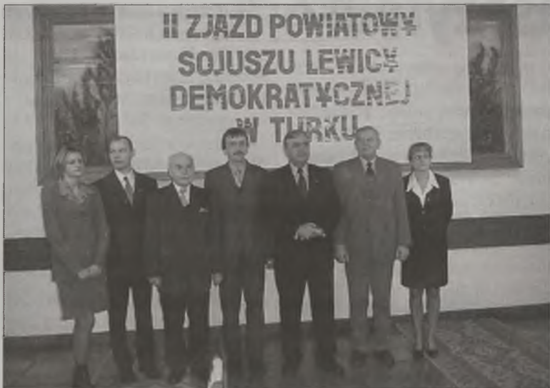
Zarząd Powiatowy SLD został wybrany dokładnie w tym samym składzie. Bo przecież zwycięskiej drużyny nie zmienia się

nać wątków o charakterze lokalnym. Na przykład dostało się byłemu już dyrektorowi konińskiego oddziału „Ruchu”, który w opinii