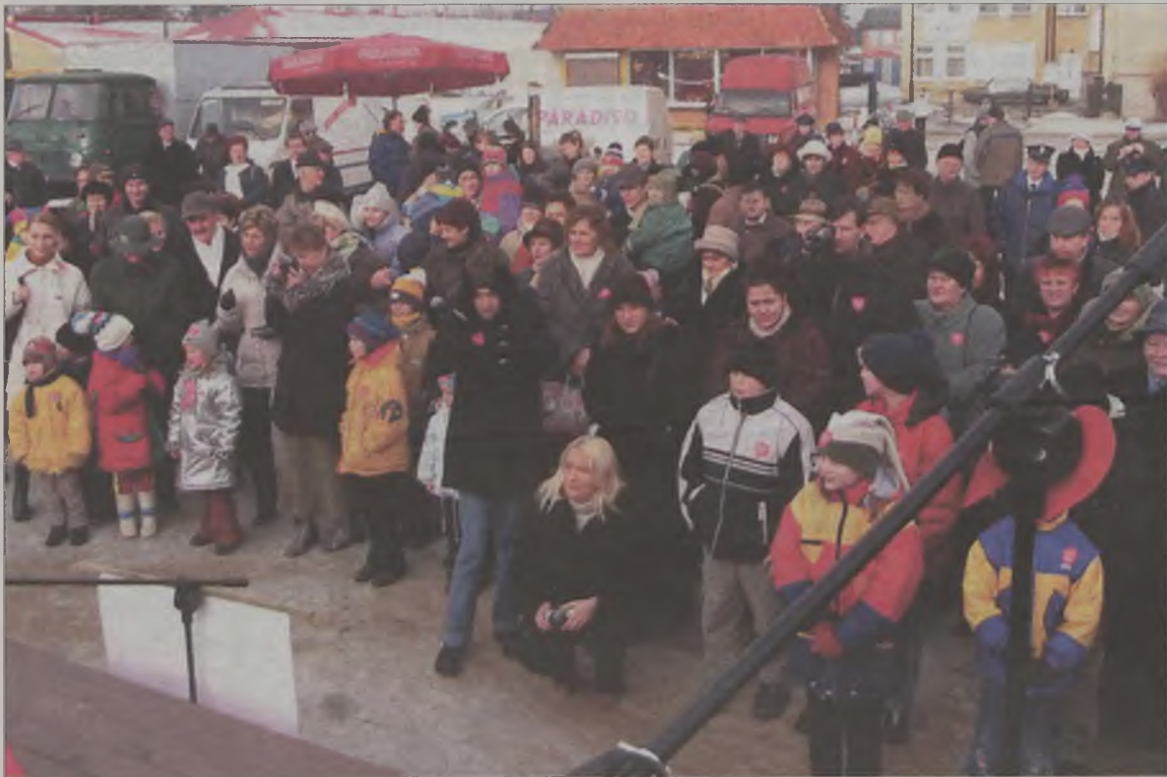
Do zabawy na powietrzu przylączyły się grupy turkowie