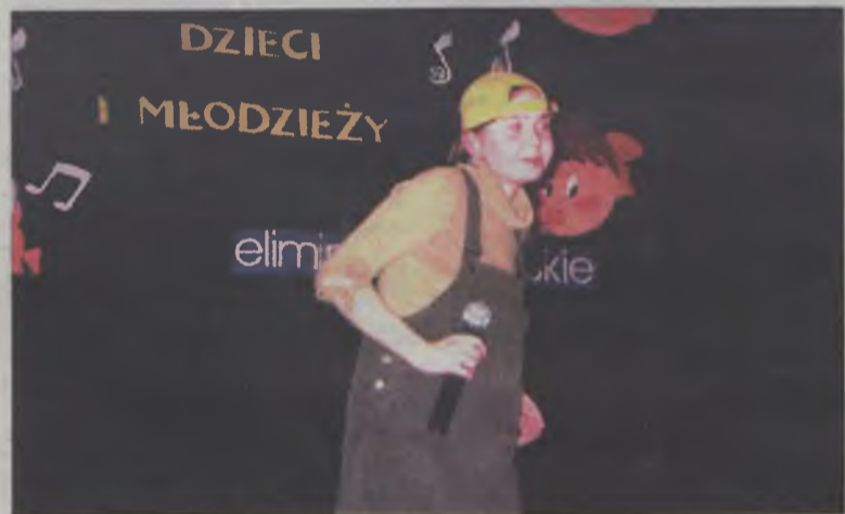
Jedna z nagrodzonych dziewcząt

W dniu 10 stycznia w sali Miejskiego Domu Kultury w Turku, odbyły się eliminacje miejsko-gminne Międzypowiatowego Festiwalu Piosenki Dzieci i Młodzieży Konin 2002.