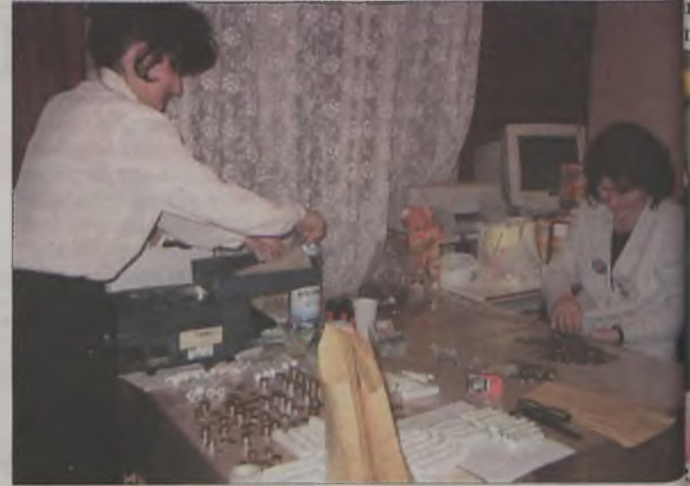
W liczeniu pieniędzy pomagały pracownice banku WKB