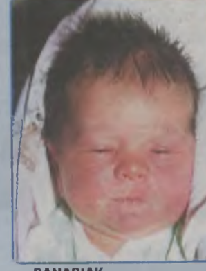
... BANASIAK syn Bożeny i Tomasza ur. 9 stycznia 2002 r., godz. 7.10 wżył 4100g, mierzył 59 cm