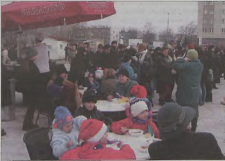
Uczestnicy biesiady przy Klubie „Barbórka” z chęcią posilali się ciepłą grochówką