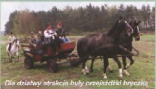
Dla dziatwy atrakcją były przejażdżki bryczką

Słaby był udział wronieckich gospodarstw agro-