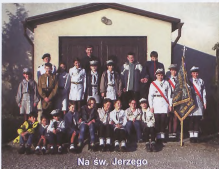
Na św. Jerzego