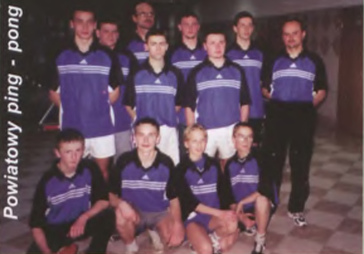
Powiatowy ping - pong