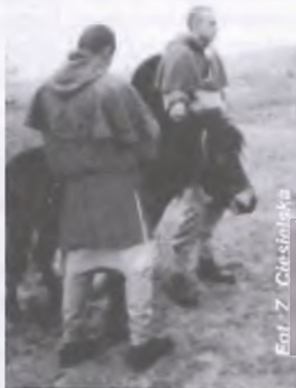
Spotkanie ze „Słowianami” z Bucharzewa

Wdzięczni uczniowie wraz z wychowawczyniami SP w Chojnie