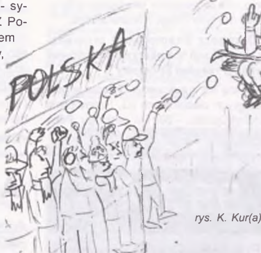
rys. K. Kur(a)

skocznia zjeżdżali po kolei narciarze państw biorących udział w konkursie, którzy dołączali do dziewcząt, prezentujących barwy poszczególnych państw. Wszystko w świetnej oprawie muzycznej. Właściwe skoki zaczęły się o 10.30.