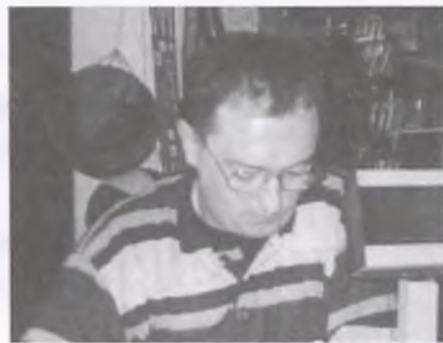
Sz. Dojas przy pracy

W poprzednim typowaniu Wronieckie Sprawy okazały się PRPROKIEM - typując bezbłędnie wynik meczu Amiki z GKS.