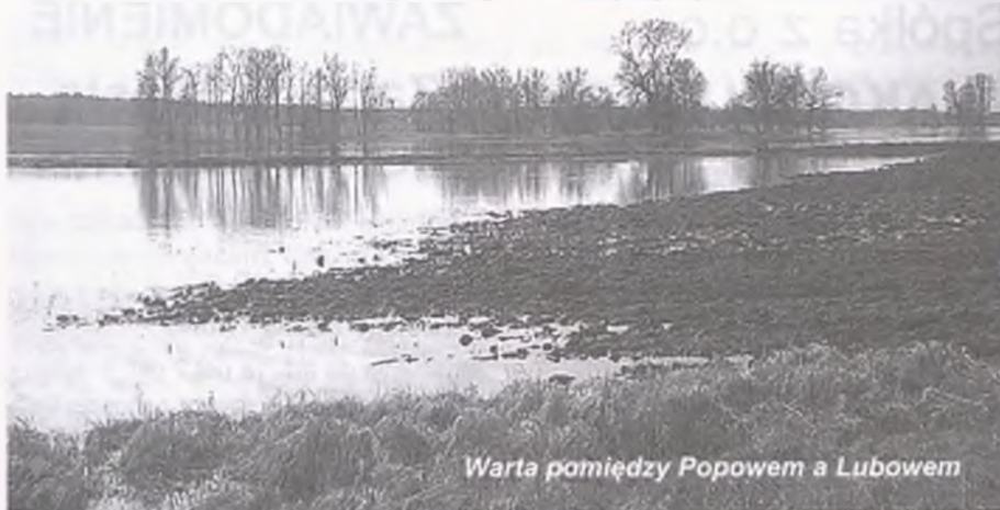
Warta pomiędzy Popowem a Lubowem