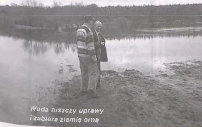
Woda niszczy uprawy i zabiera ziemię orną

Tegoroczna zima potwierdza teorię o rozchwianiu naszego klimatu. Po grudniowym mrozie w ciągu dwóch dni w początkach stycznia przyszła nagła odwilż. Potem w połowie miesiąca znów nastąpił skok do długotrwałego ocieplenia typowego dla wiosny. Tegoroczny luty był znacznie cieplejszy od normalnego. Średnia temperatura miesiąca w Warszawie wynosiła plus 3,7 st. i była o 4,9 st. wyższa od średniej wieloletniej (minus 1,7 st.) - informuje IMGW.