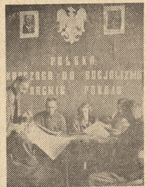
Uruchomiono czytelnictwo gazet i czasopism. Na zdjęciu pierwsi czytelnicy w dniu otwarcia czytelnictwa