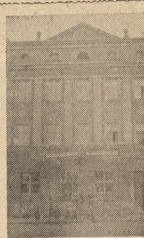
Wspaniały gmach Biblioteki Miejskiej (pow. krotoszyński). W ramach tegorocznych zobowiązań pierwszomajowych koźmińskiego świata pracy — gmach został odnowiony

Członkowie Polskiego Związku Wędkarskiego w Wolsztynie w celu wprowadzenia racjonalnej gospodarki rybnej na wodach dzierzawionych przez PZW powzięli uchwałę: dążyć do zarybienia wszystkich wód nadających się do