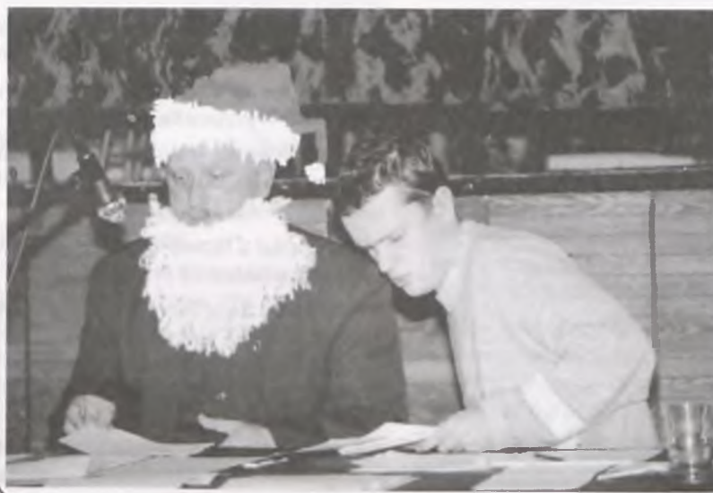
Redaktor niezależnej Gazety Szamotulskiej przedstawił pierwszemu Gwiazdorowi gminy Wronki listę życzeń wronczan do projektu budżetu na 2002. rok.