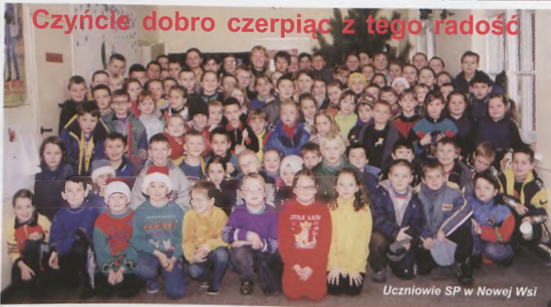
Uczniowie SP w Nowej Wsi

Już po raz trzeci w Szkole Podstawowej w Nowej Wsi przeprowadzona została akcja wychowawczo – charytatywna pod hasłem Przedświąteczna zbiórka żywności. Trzy tygodnie przed świętami wszyscy uczniowie zostali poinformowani o planowanej akcji. Wszyscy otrzymali ulotki, z którymi mogli zapoznać się rodzice. Tam można było znaleźć podstawowe informacje o zbiórce. Te ulotki, po wpisaniu danych ucznia, stawały się losami loterii w momencie, gdy dany uczeń składał ofiarowaną żywność w punkcie zbiórki.