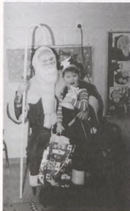
fol.: G. Kaźmierczak

Spotkanie z Gwiazdorem i wigilijnym opłatkami w Przedszkolu nr 2 było bardzo uroczyste, a zarazem ciepłe, serdeczne, domowe. Na pamiątkę zostały wspomnienia, zdjęcia, nagrane kasety i głębo-