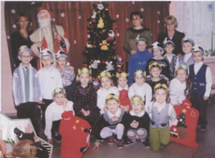
▲ Grupa sześciolatków z Gwiazdorem i prezentami