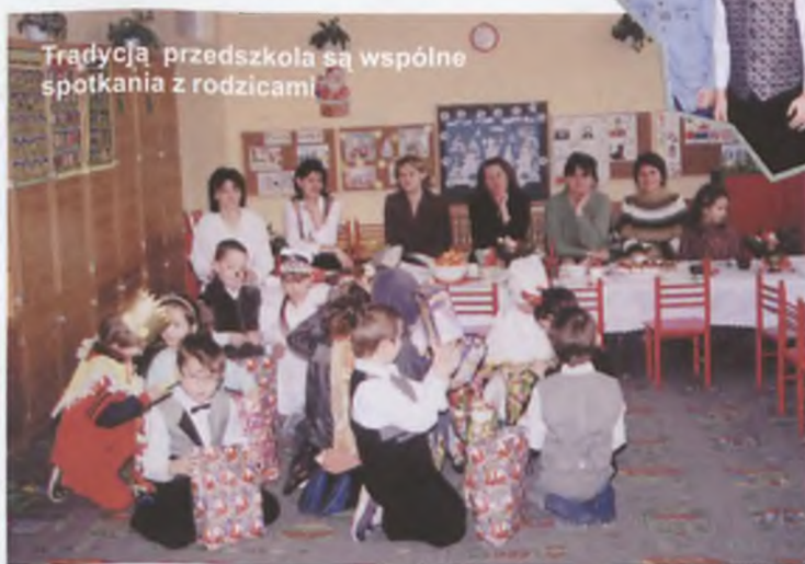
Tradycją przedszkola są wspólne spotkania z rodzicami