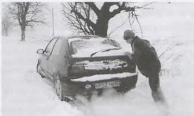
Punto fotoreportera „WS” podobnie utknęło w zaspie, nie dojechało, z trudem udało się wycofać na szosę Wronki - Sieraków

Utrzymaniem dróg i ulic na terenie całej gminy zajmuje się z wyboru Zarząd SUR Cmachowo. P.B.