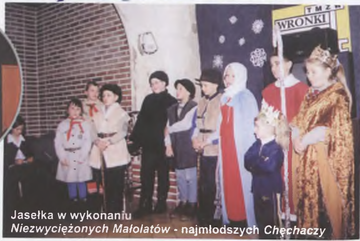
Jasełka w wykonaniu Niezwyciężonych Małolatów - najmłodszych Chęchacz