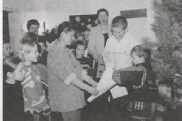
fol.: G. Kaźmierczak

NA OKŁADCE: Migawki z imprez okoloświątecznych