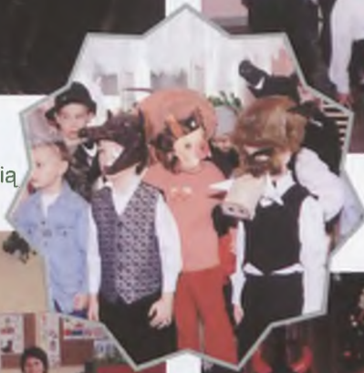
◀ Występy sześciolatków ▶