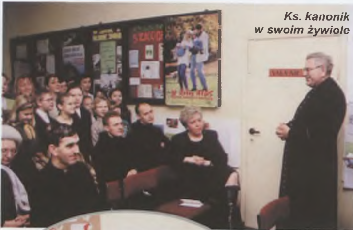
Ks. kanonik w swoim żywiole